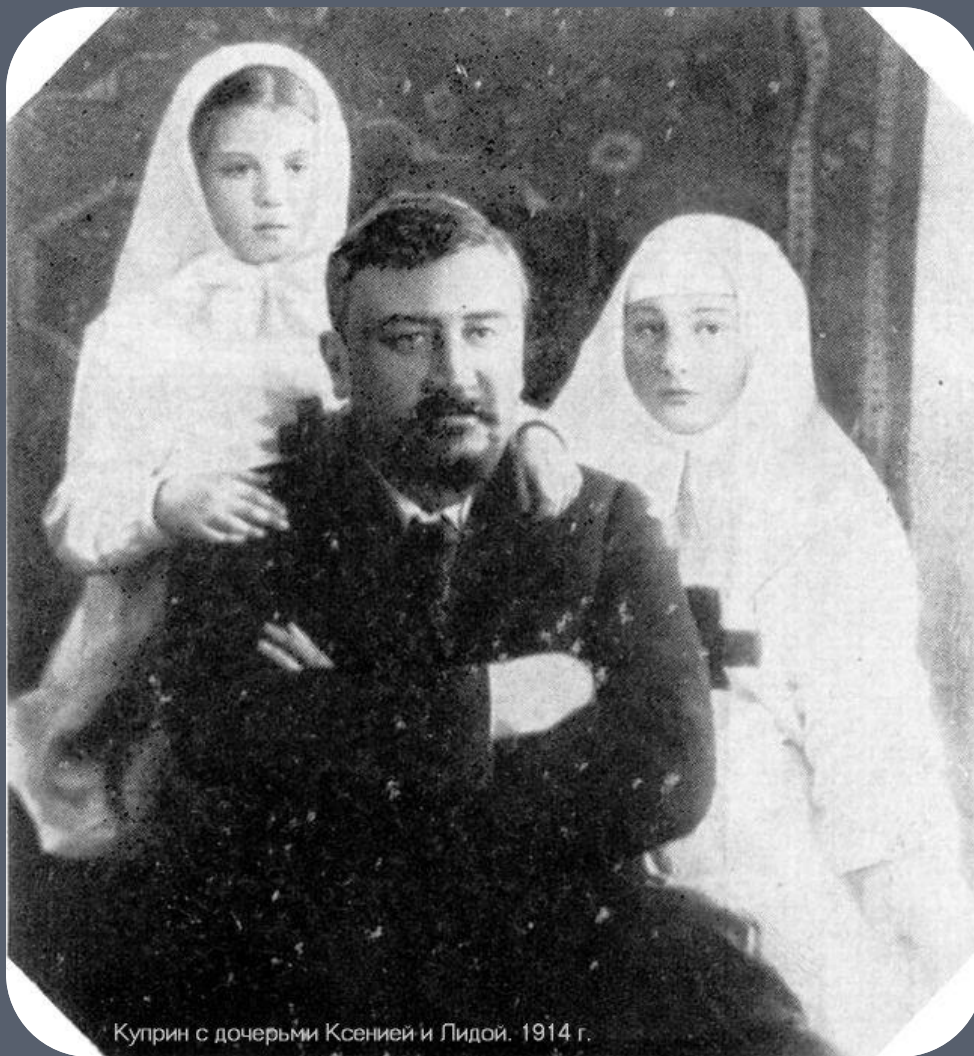
Куприн с дoчepьми Ксeниeй и Лидoй. 1914 г.