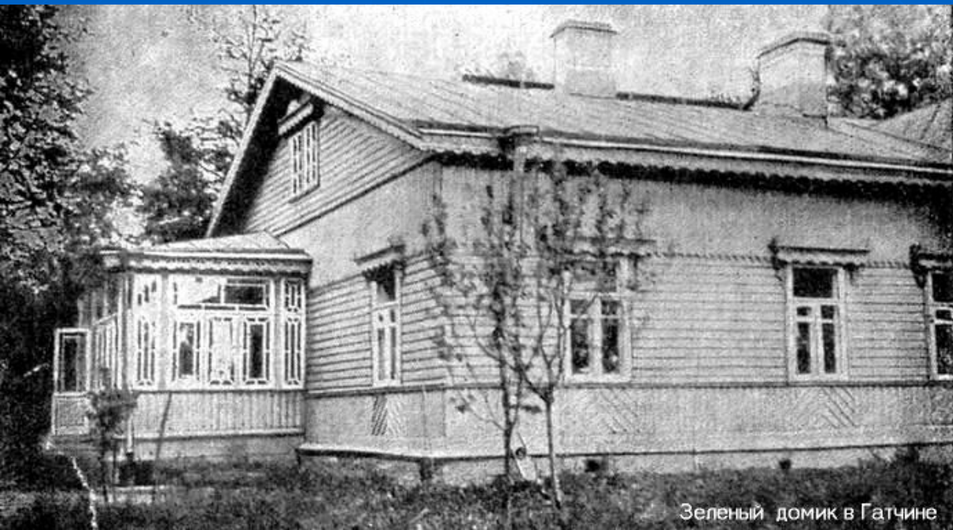
Зеленый домик в Гатчине