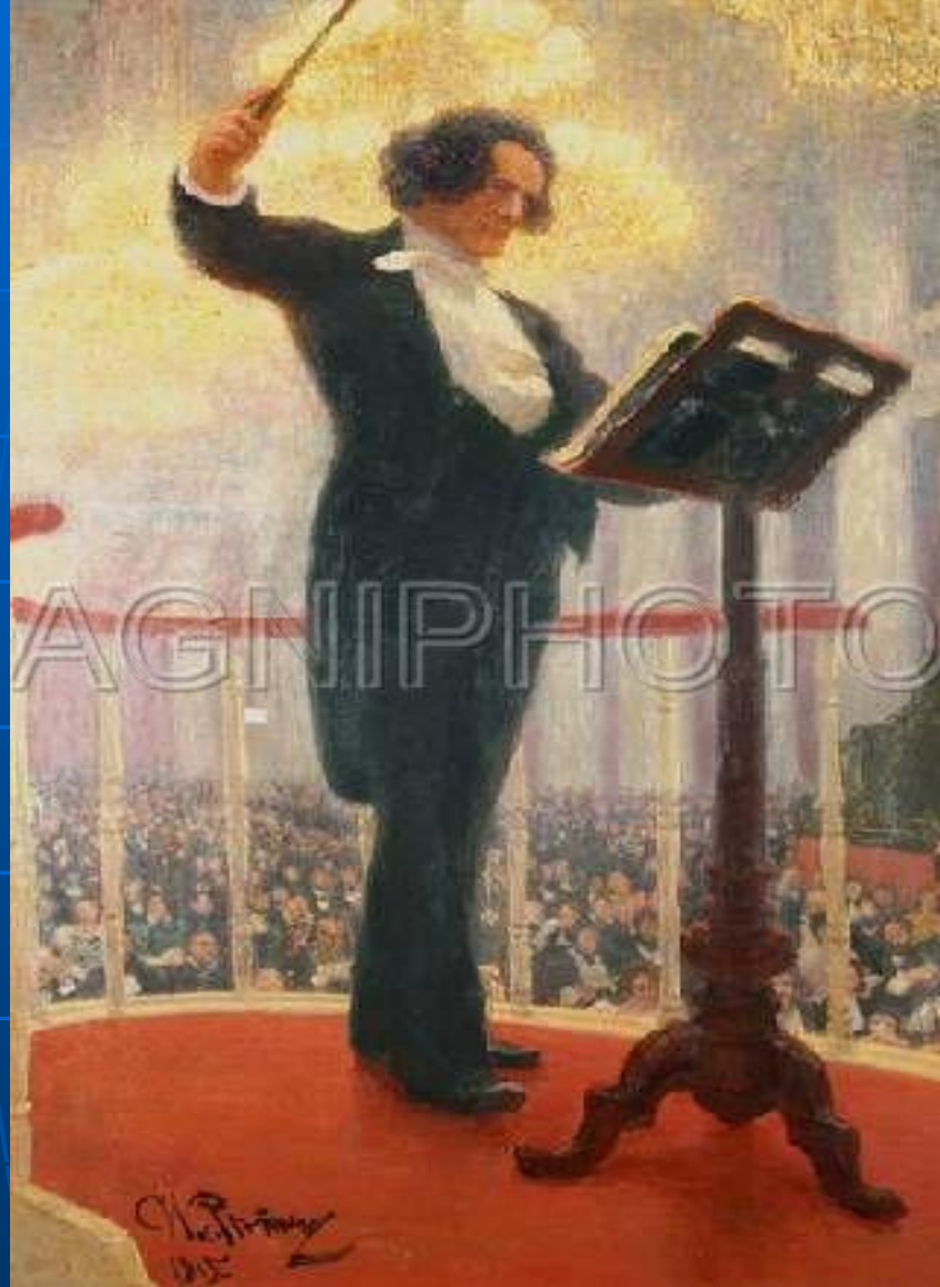
РУБИНШТЕЙН, АНТОН ГРИГОРЬЕВИЧ (1829–1894), русский композитор и пианист. Родился 16 (28 ноября) 1829 в деревне Выхватинцы Подольской губернии.