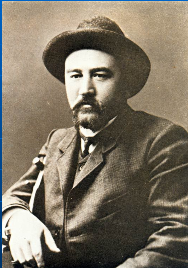
Александр Иванович Куприн