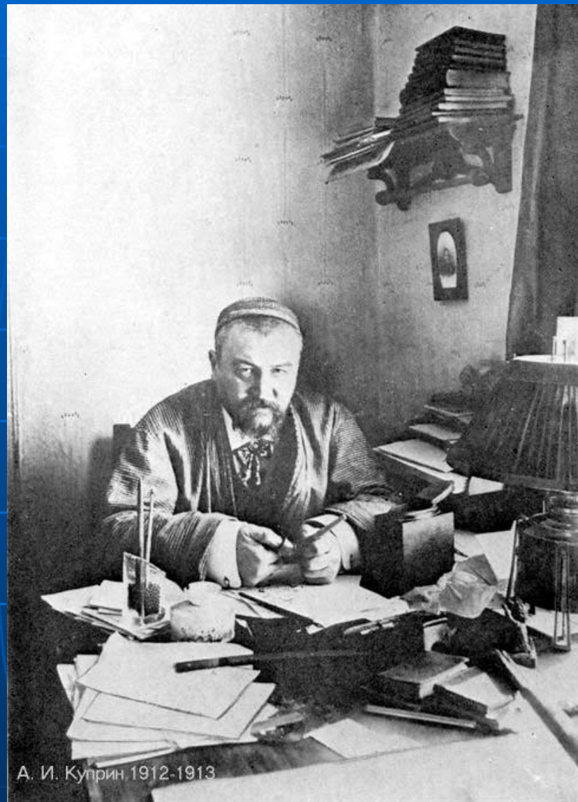
А. И. Куприн. 1912-1913