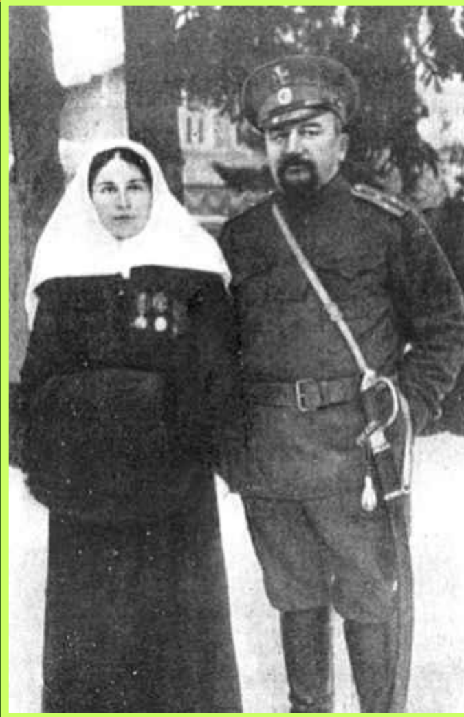
А.И.КУПРИН И Е.М.КУПРИНА