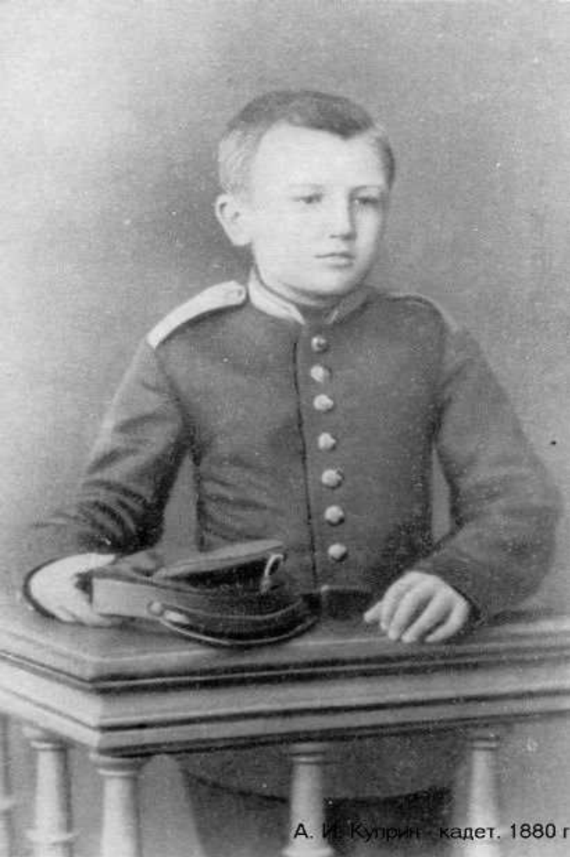
А. И. Куприн - кадет, 1880 г