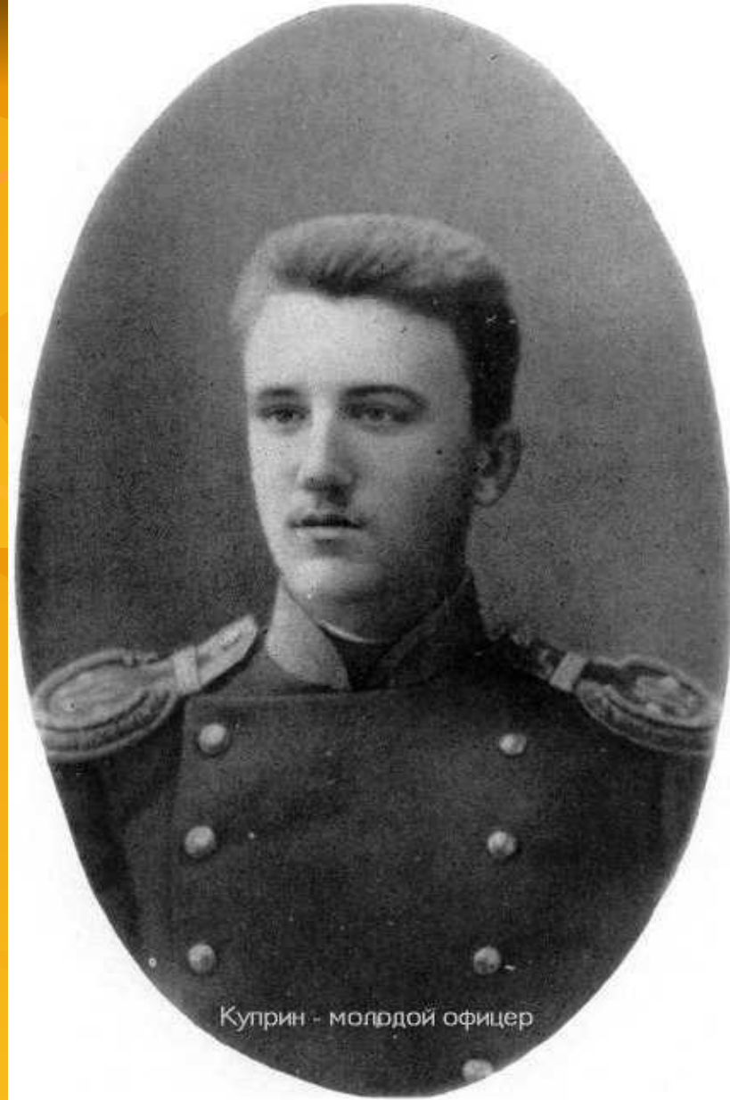
Куприн - молодой офицер