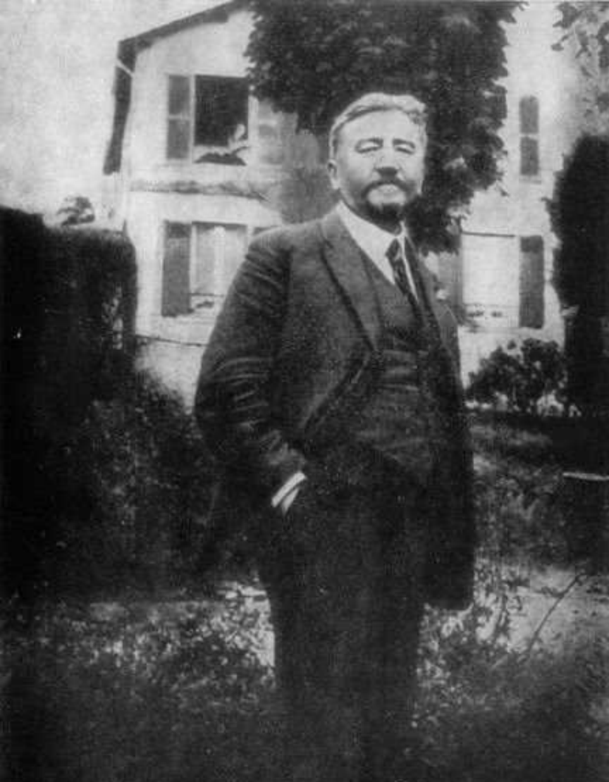
А. И. Куприн. Пригород Парижа Севр Виль д'Авре. 1922 г.