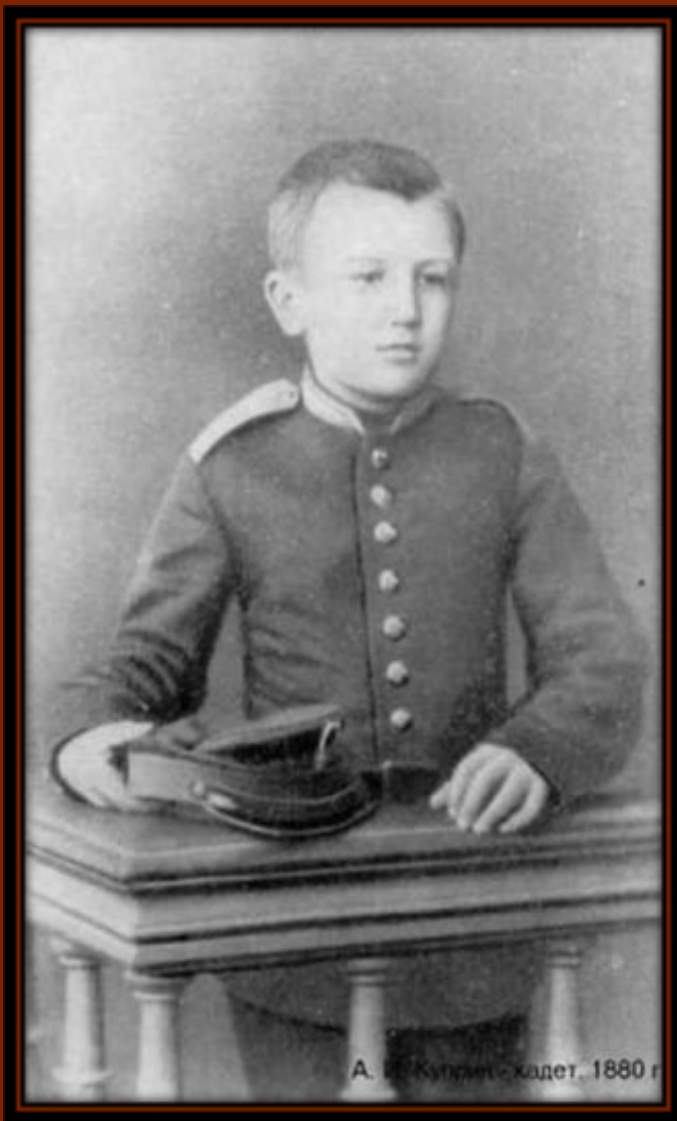
А. В. Куприн, кадет, 1880 г.