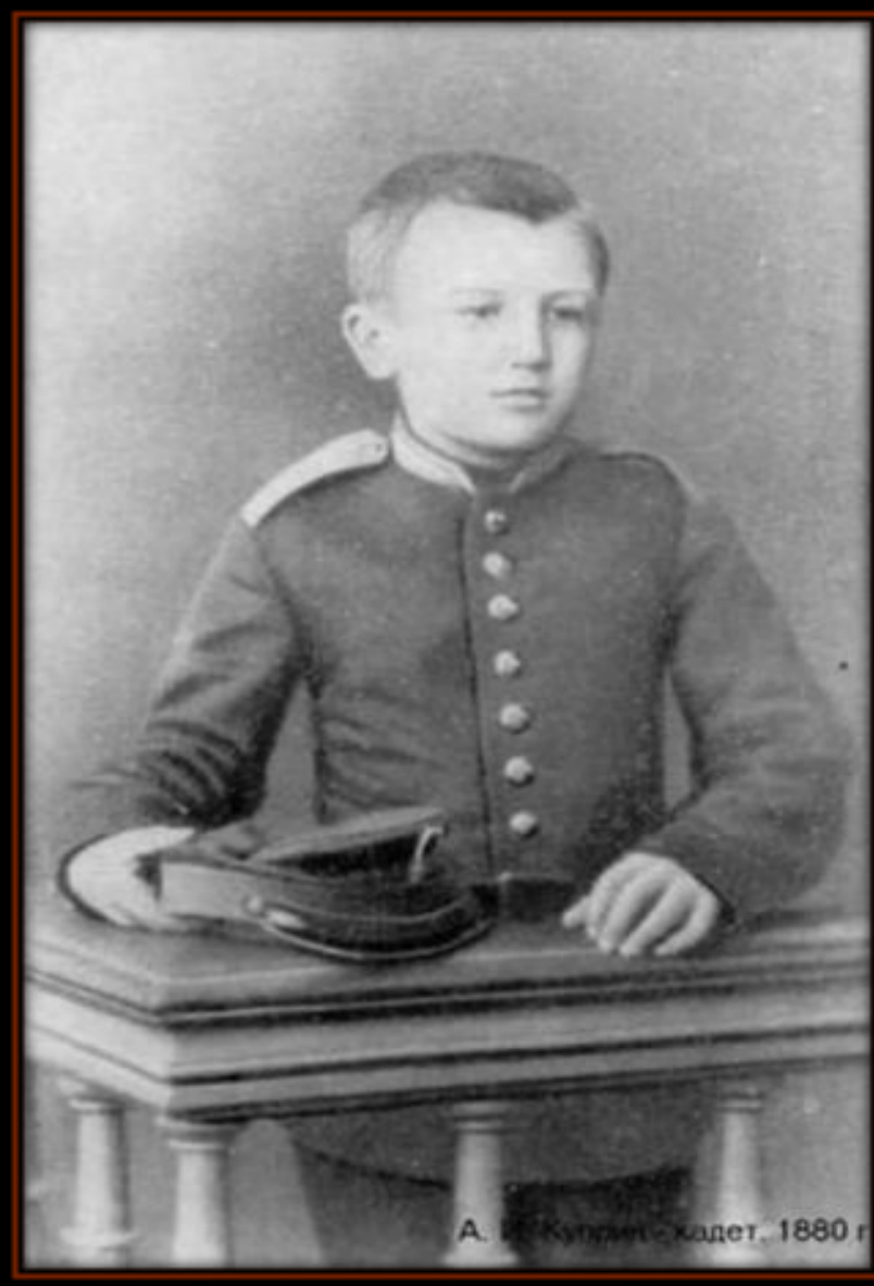
А. И. Куприн - кадет, 1880 г.