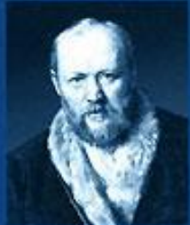
Александр Николаевич ОСТРОВСКИЙ