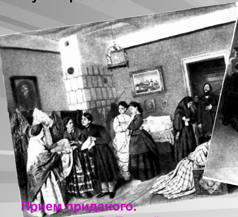
Прием приданого. С картины В. Пукирёва.

А. Н. Островский, с детства наблюдавший жизнь купцов, в совершенстве изучил быт, семейные и имущественные отношения их во время почти восьмилетней службы в Московском совестном, а затем Коммерческом суде, куда поступил по настоянию отца в 1843 году, не окончив университета