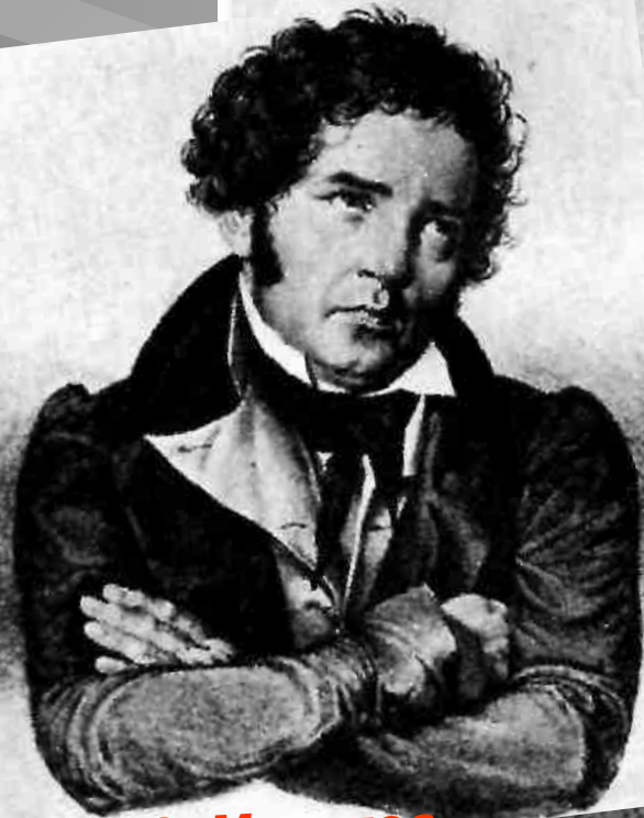
П. С. Мочалов