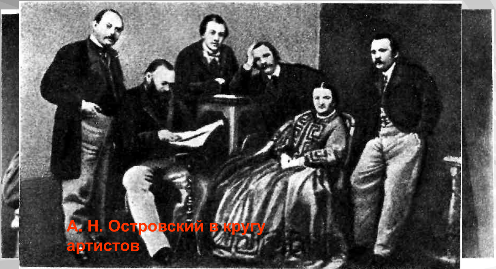
А. Н. Островский в кругу артистов

Считая специальную подготовку воспитания и обучения актера «делом государственной важности», А. Н. Островский в 1865 году вместе с композитором Н. Г. Рубинштейном организует Артистический кружок. Кружок дал русскому театру М. П. Садовского, О. О. Садовскую, В. А. Макшеева. Здесь «впервые познакомилась московская публика с огромным талантом П. А. Стрепетовой».