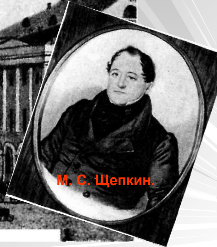
М. С. Щепкин.