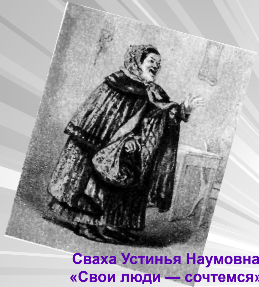
Сваха Устинья Наумовна. «Свои люди — сочтемся». С рисунка Я. Боклевского. 1859.