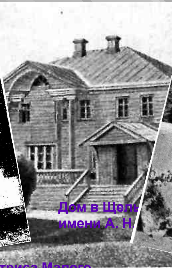
Дом в Щелы имени А. Н.