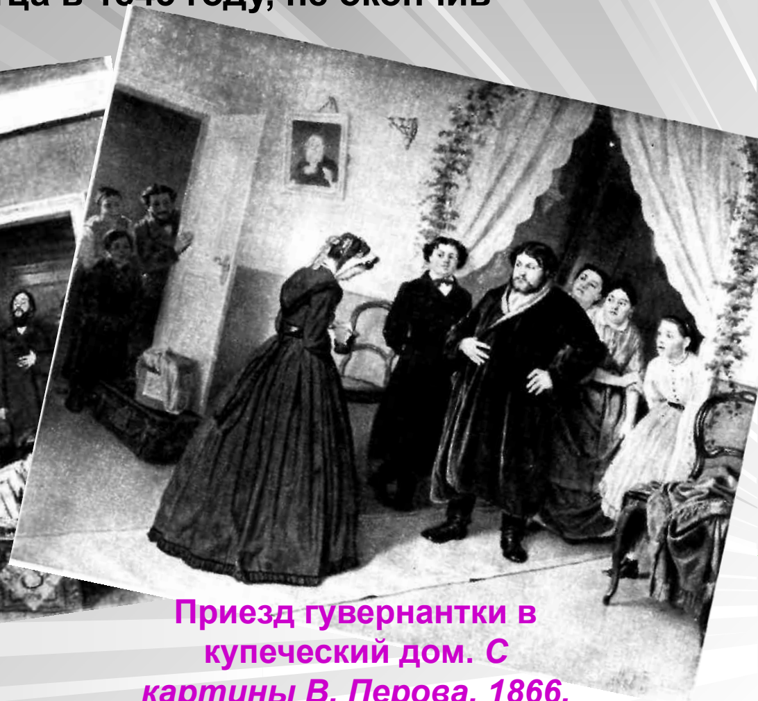
Приезд гувернантки в купеческий дом. С картины В. Перова. 1866.