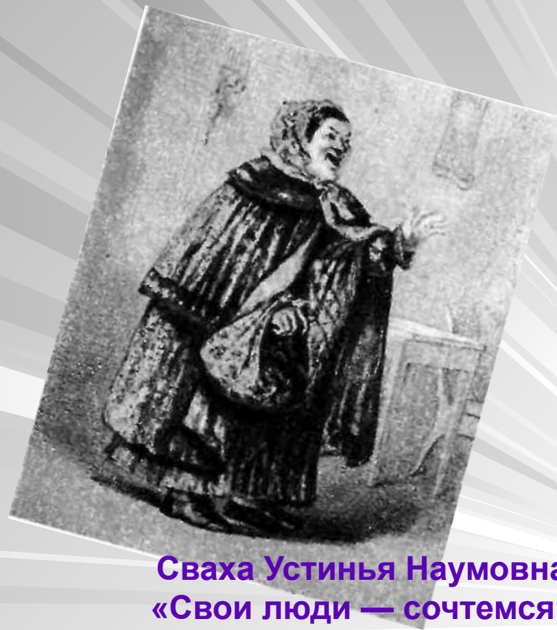
Сваха Устинья Наумовна. «Свои люди — сочтемся». С рисунка Я. Боклевского. 1859.