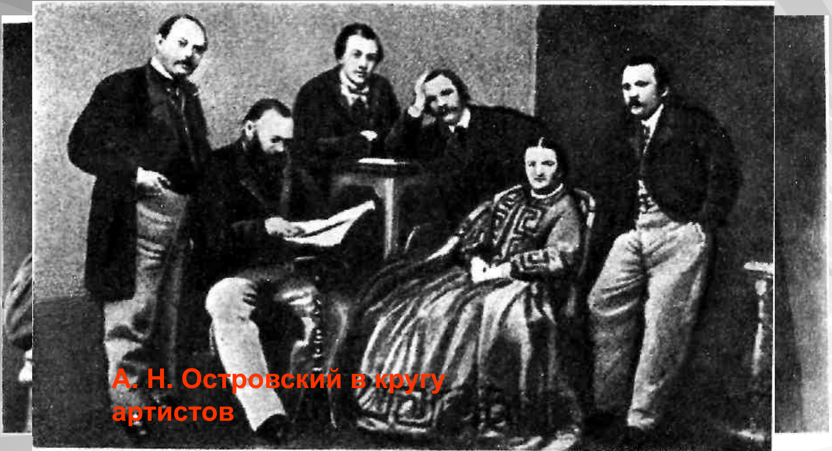
А. Н. Островский в кругу артистов

Считая специальную подготовку воспитания и обучения актера «делом государственной важности», А. Н. Островский в 1865 году вместе с композитором Н. Г. Рубинштейном организует Артистический кружок. Кружок дал русскому театру М. П. Садовского, О. О. Садовскую, В. А. Макшеева. Здесь «впервые познакомилась московская публика с огромным талантом П. А. Стрепетовой».