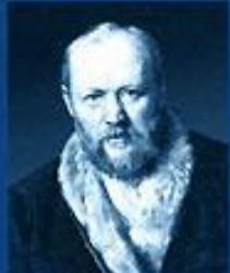
Александр Николаевич ОСТРОВСКИЙ