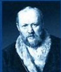
Александр Николаевич ОСТРОВСКИЙ