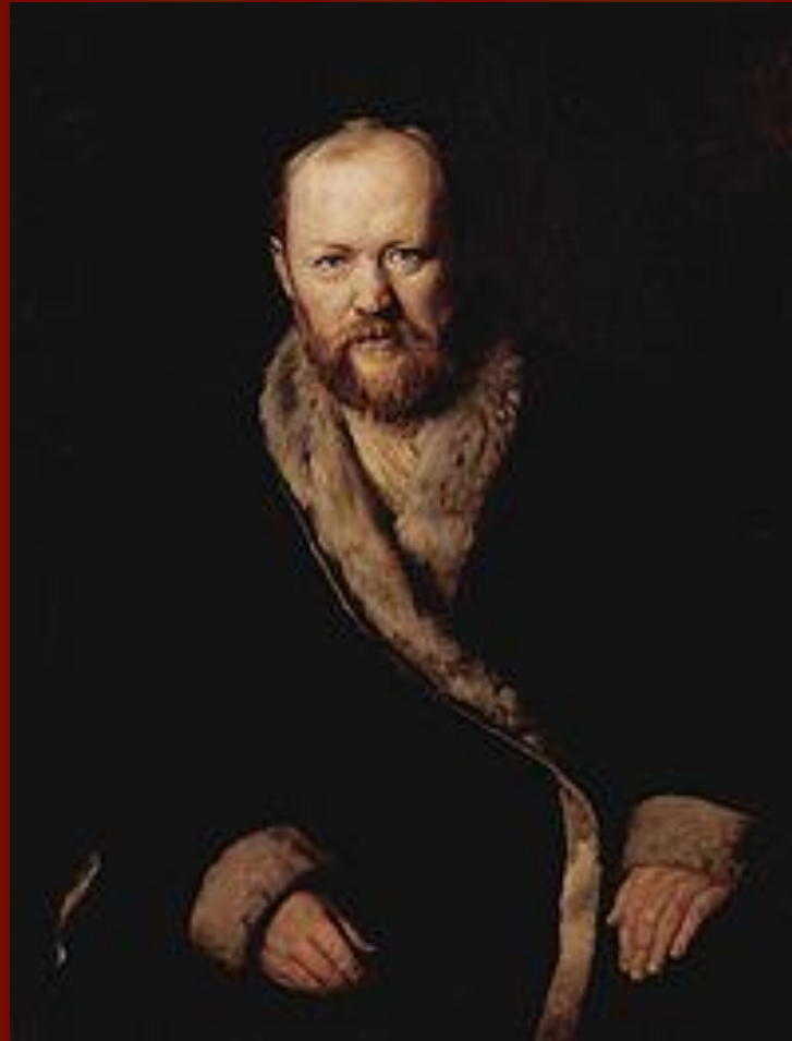
В.Г.Перов Портрет А.Н.Островского (1877)