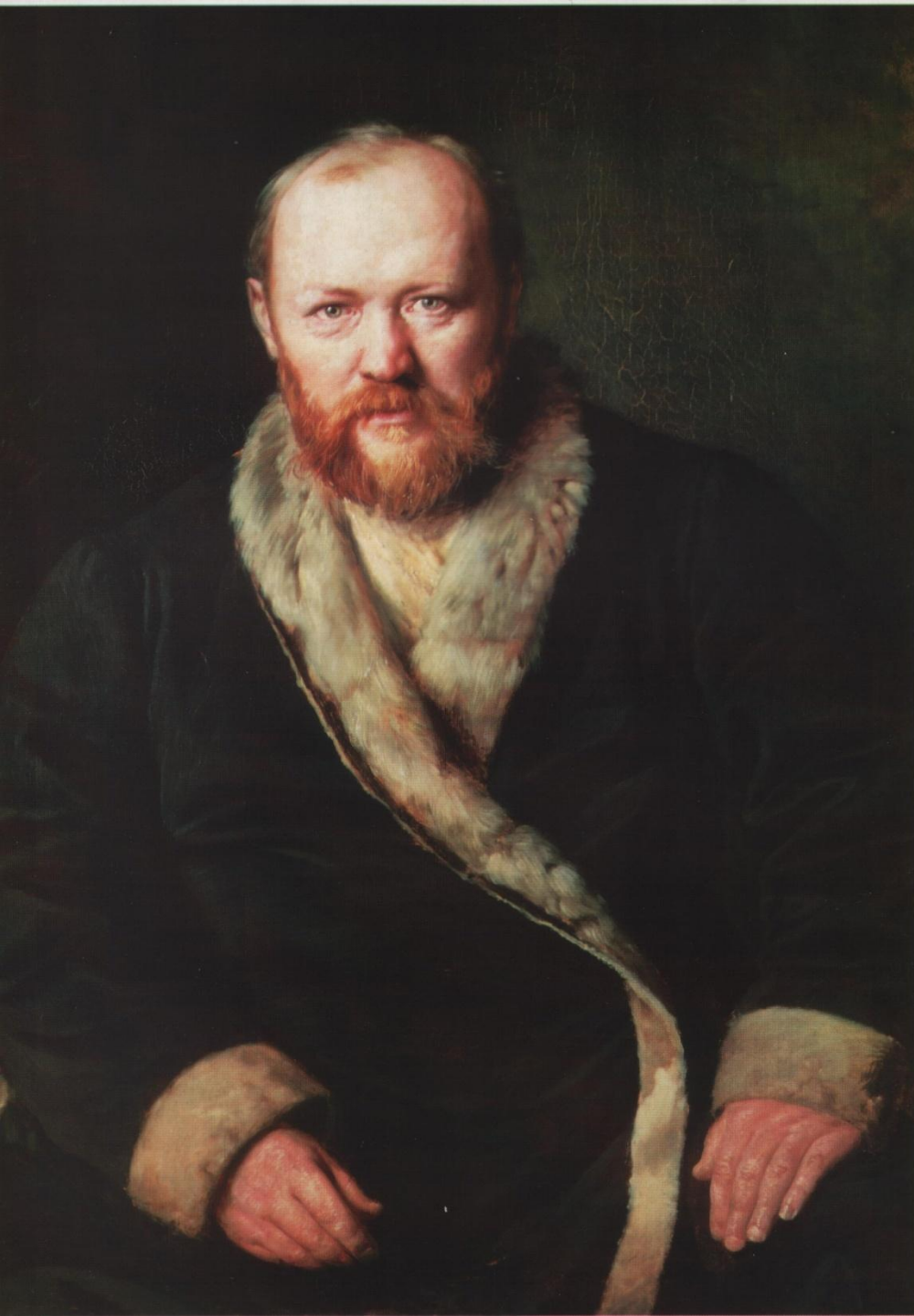
Александр Николаевич Островский (1823-1886гг.)