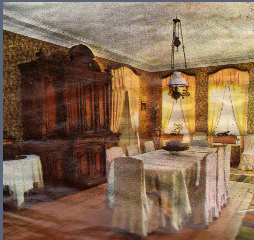
Столовая в доме Островского

«... живу в той стране, где дни разделяются на лёгкие и тяжёлые; где люди твёрдо уверены, что земля стоит на трёх рыбах и что по последним известиям, кажется, она начинает шевелиться: значит, плохо дело; где заболевают от дурного глаза, а лечатся симпатиями... Одним словом, я живу в пучине» - слова одного из героев пьес драматурга.