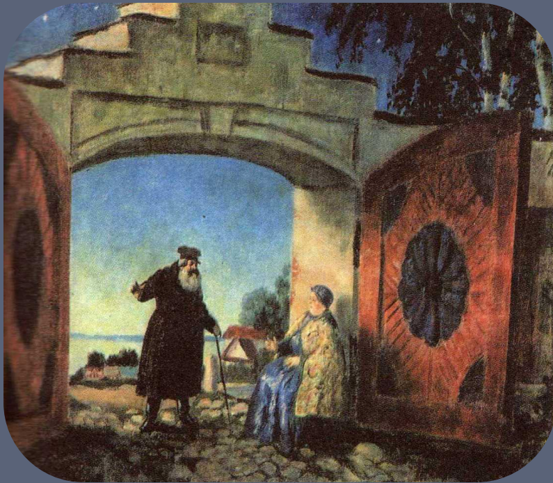
Б.М. Кустодиев. Эскиз декорации к драме «Гроза» А.Н. Островского