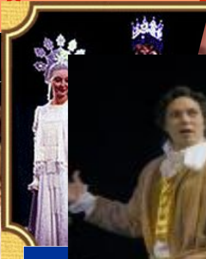
Сцена из др