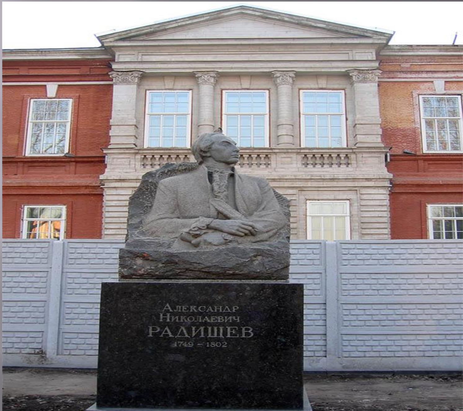
АЛЕКСАНДР НИКОЛАЕВИЧ РАДИШЕВ 1749 - 1802