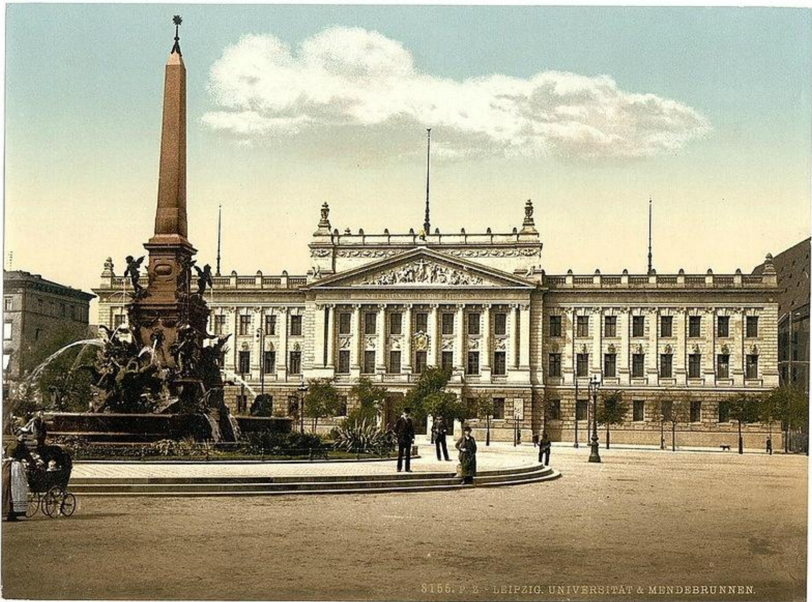
8156. P. Z. - LEIPZIG. UNIVERSITÄT & MENDELBRUNNEN.