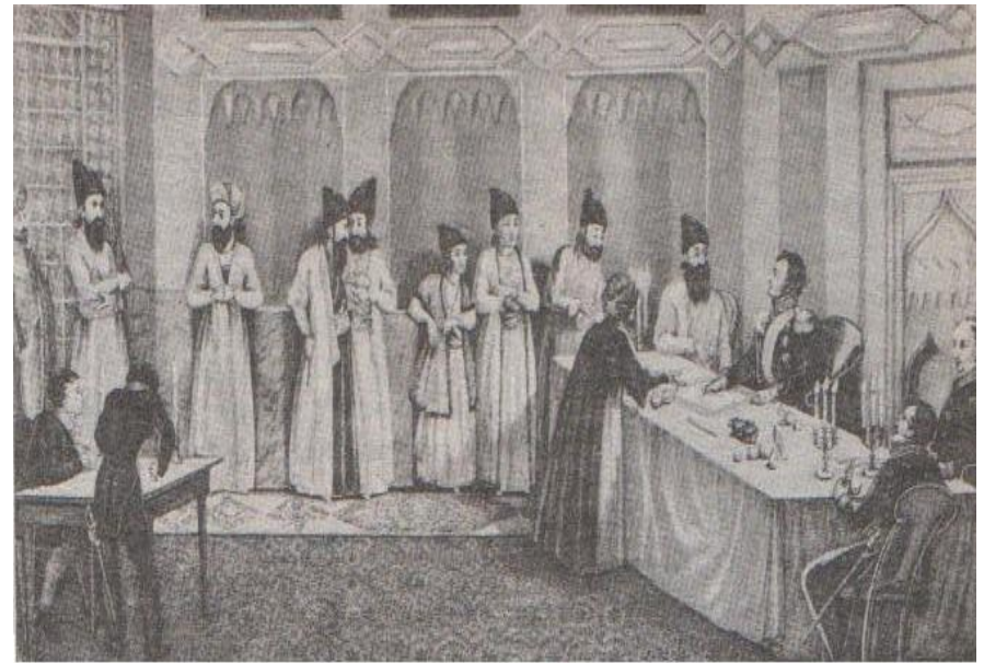
Заклочение Туркманчанского договора после войны между Росней и Турцией 1828-1829гг. (Справа, у торца стола, сидит Грибоедов)

30 января 1829 года посольство в Турции было разрушено, и все, кто в нем находились, перебиты. Похоронили Грибоедова в его любимом Тифлисе, в монастыре святого Давида на горе Мтацминда.