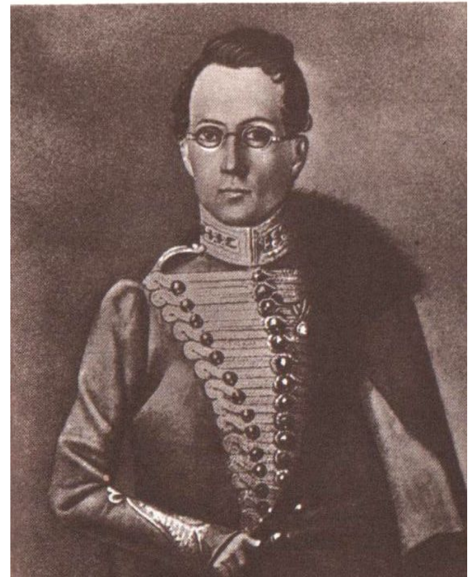
А.С.Грибоедов в форме Иркутского полка

В 1806 году он поступил на словесный факультет, а в 1808 году окончил его. При нашествии Наполеона он записался офицером в ополчение. Молодость Грибоедов провел бурно. Себя и своих однополчан, братьев Бегичевых, он называл «пасынками здравого рассудка» - так необузданны были их проказы.