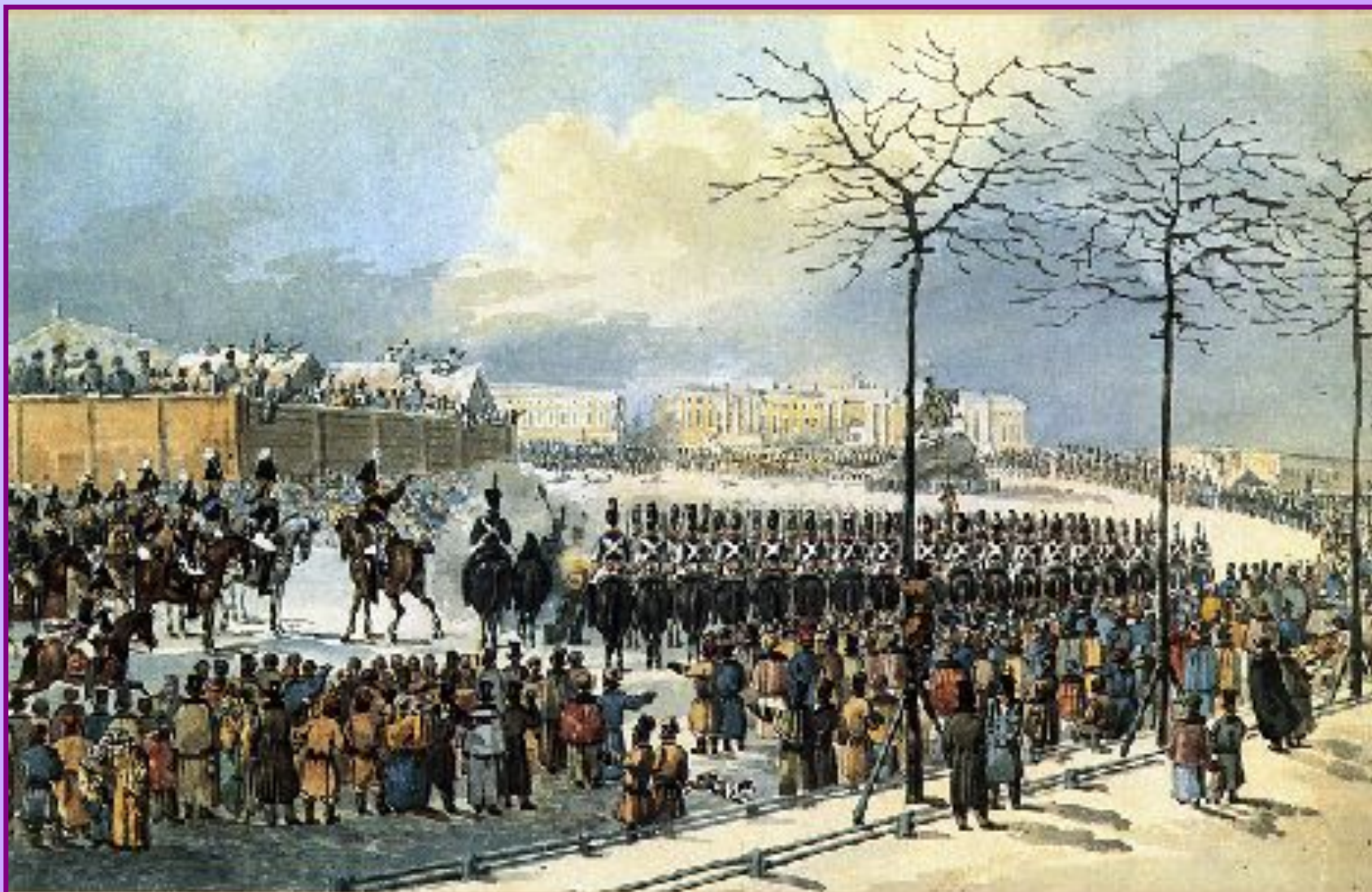
К. Кольман. 14 декабря 1825 г. на Сенатской площади.