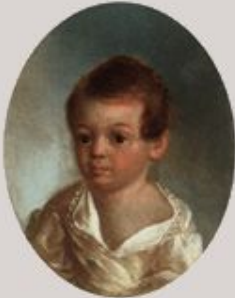
К. Де-Местр. Пушкин-ребенок (1801-1802)