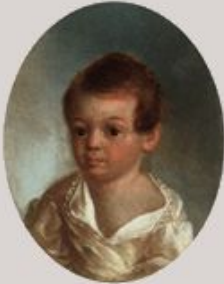
К. Де-Местр. Пушкин-ребенок (1801-1802)