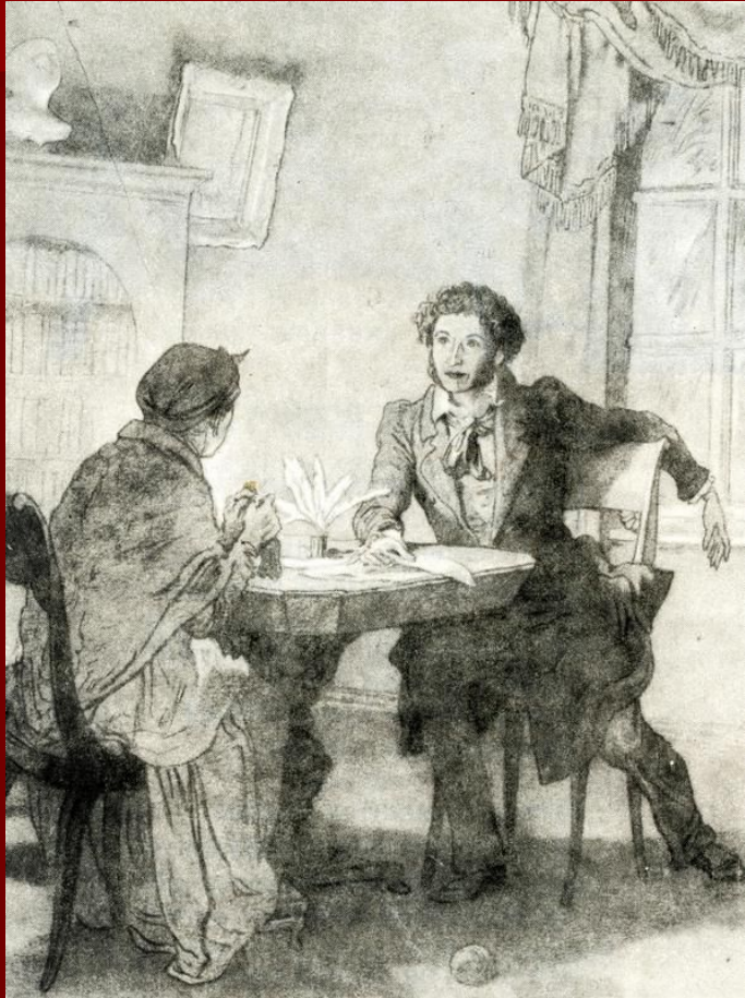
Иллюстрация к стихотворению «Зимний вечер»

Забота и любовь Арины Родионовны скрашивали поэту ссылку. Пушкин по-настоящему крепко любил свою няню и написал несколько трогательных стихотворений, к ней обращенных.