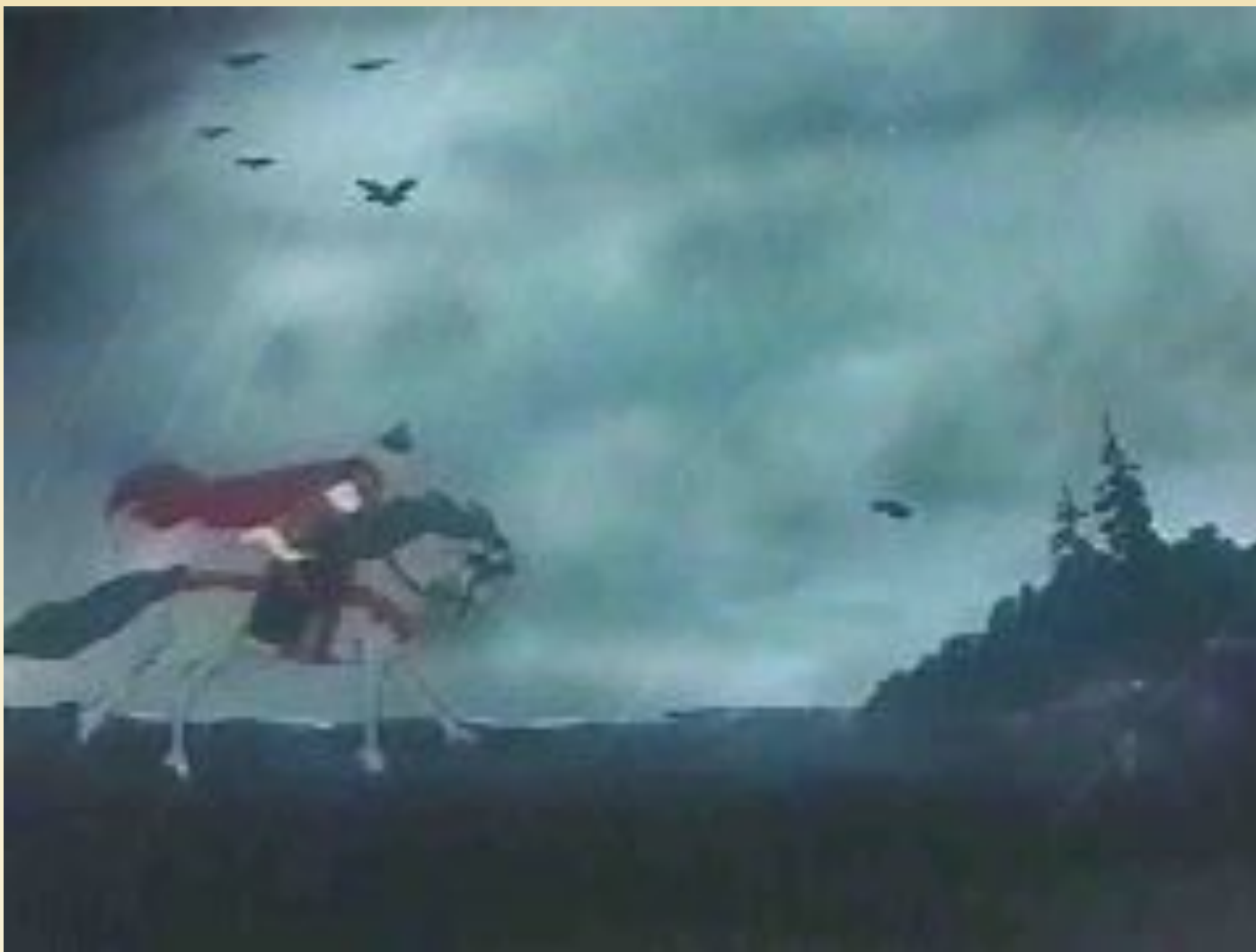
Фрагмент из мультфильма «Сказка о мертвой царевне и семи богатырях».