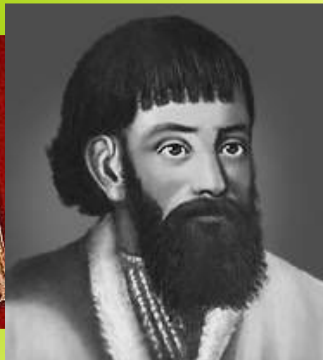
Е. И. Пугачев.