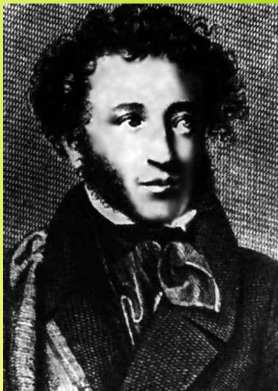
А. С. Пушкин.