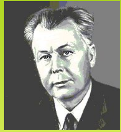
А. Т. Твардовский.