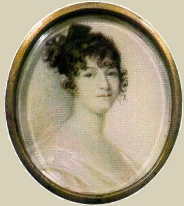
Миниатюра Ксавье де Местра. Н.О. Пушкина. 1800-е гг.

Отец Пушкина Сергей Львович и мать Надежда Осиповна были дальними родственниками - троюродные брат и сестра.