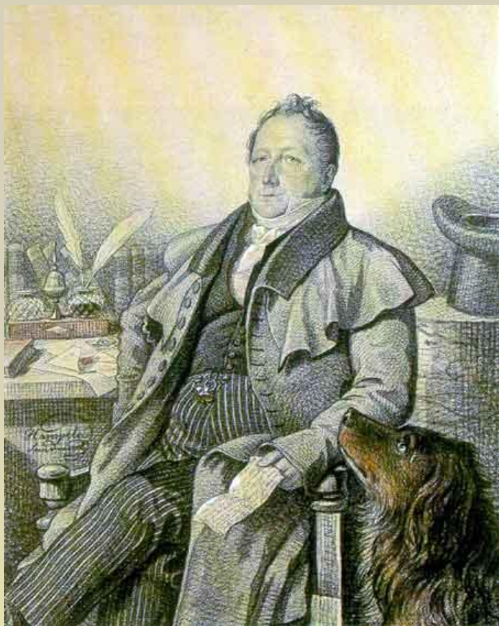
Г.Кампельон С.Л. Пушкин. 1824.

В их доме собирались поэты, художники, музыканты.