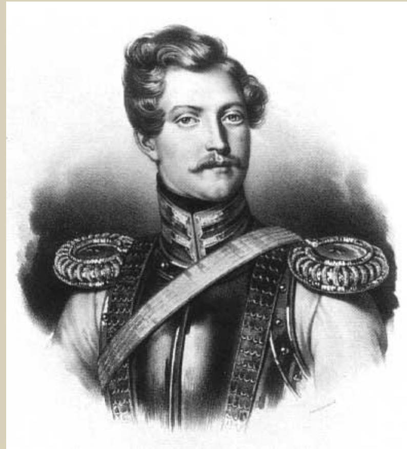
Бенар с оригинала неизвестного художника Ж. Дантес-Геккерн. 1830-е гг

В 1835 году появился повод к дуэли, когда молодой офицер Дантес начал ухаживать за Натальей Николаевной, чему она была не против.