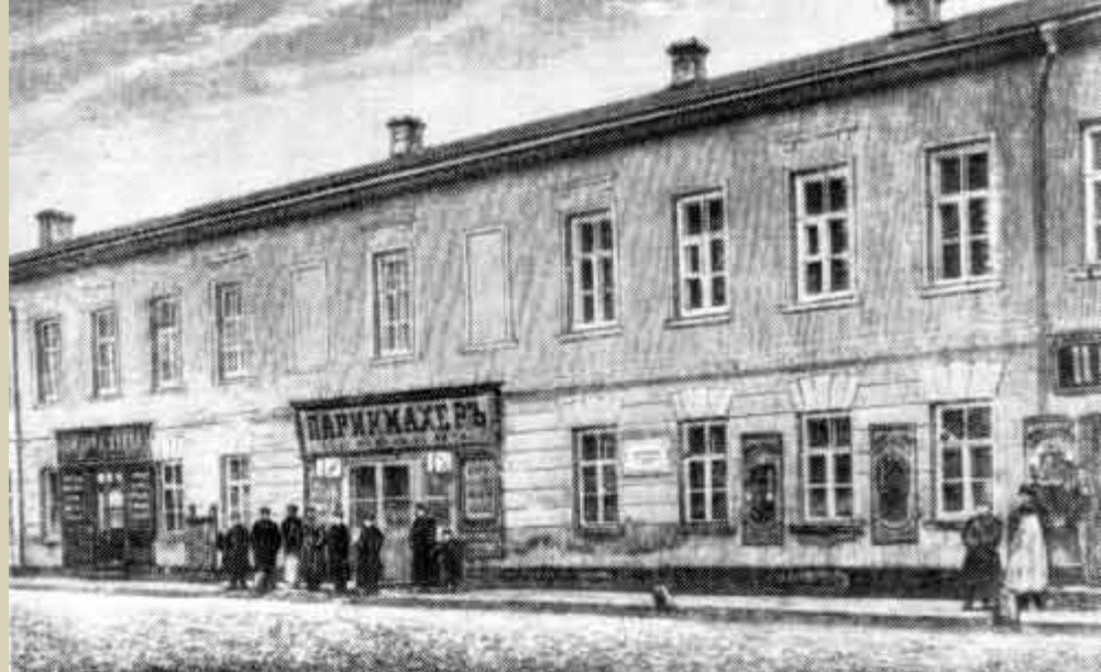
Дом на Немецкой улице в Москве, где родился А.С.Пушкин С фотографии конца XIX века

Отец его, Сергей Львович (1771 -1848 ), происходил из помещичьей, когда-то богатой семьи.