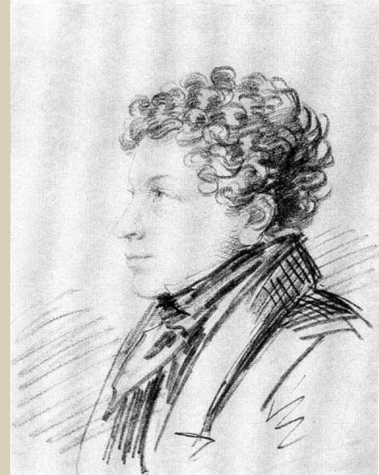
А.О. Орловский Л.С. Пушкин. Первая половина 1820-х гг.

Кроме Александра у Пушкиных были дети - старшая дочь Ольга и младший сын Лев.