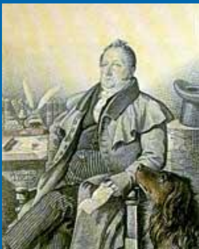
□ Отец, Сергей Львович Пушкин (1770-1838г. )