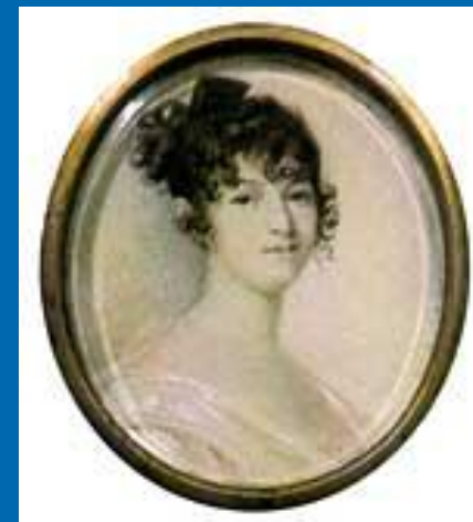
Мать, Надежда Осиповна Пушкина (1775-1836г.)