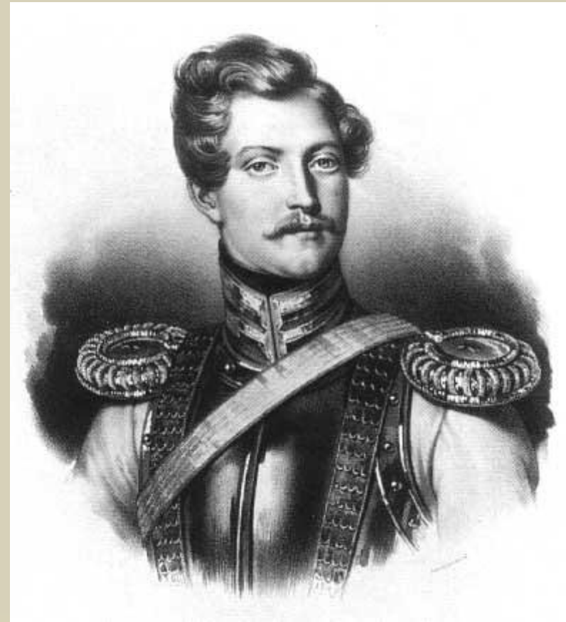
Бенар с оригинала неизвестного художника Ж. Дантес-Геккерн. 1830-е гг

В 1835 году появился повод к дуэли, когда молодой офицер Дантес начал ухаживать за Натальей Николаевной, чему она была не против.