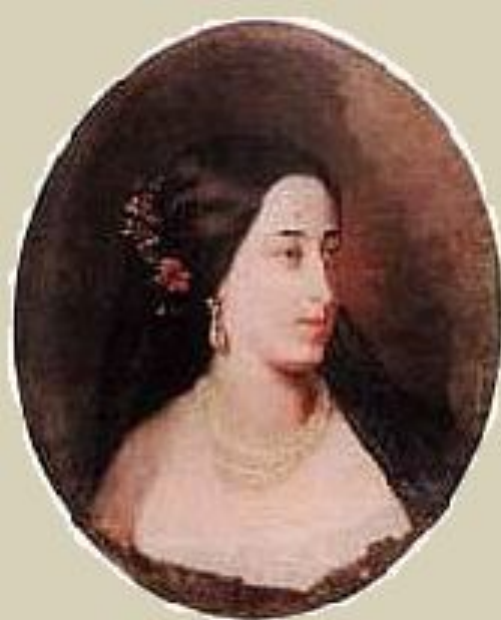
Старшая дочь, Мария Александровна Пушкина (1832-1919г.)