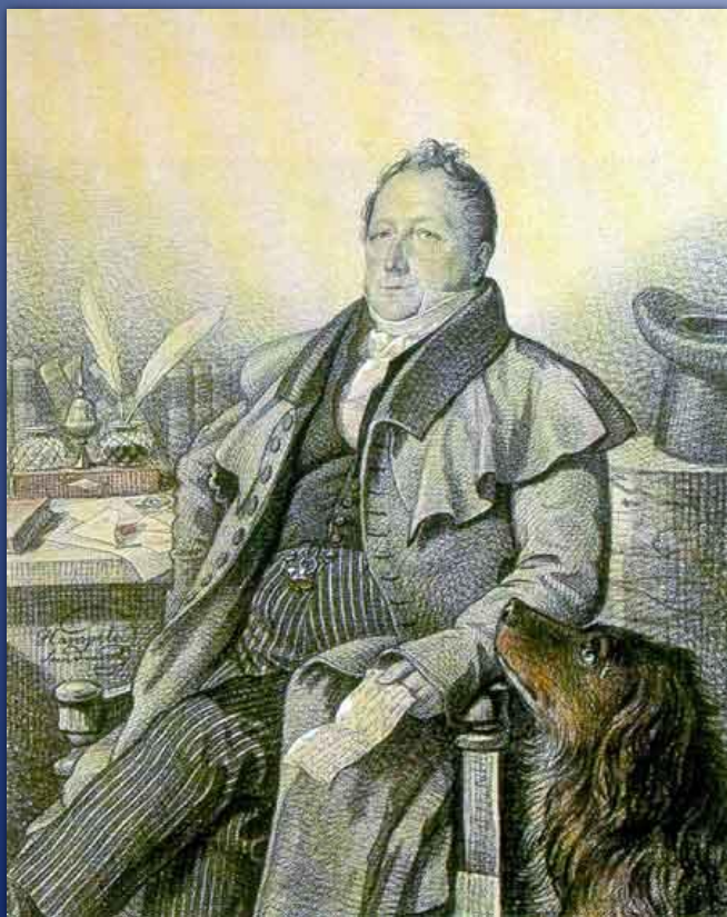
С.Л. Пушкин. 1824.

Отец, Сергей Львович , небогатый помещик, человек образованный, хорошо знал литературу, был знаком со многими русскими писателями и сам немного писал.