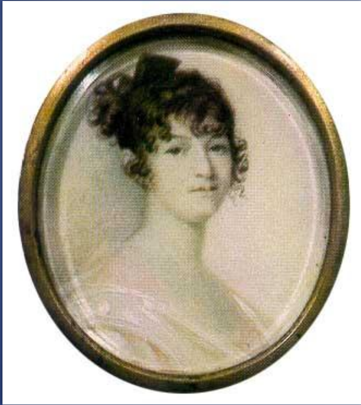
Н.О. Пушкина. 1800-е гг.

Мать, Надежда Осиповна , приходилась внучкой арапу Петра I, впоследствии русскому генералу Ганнибалу.