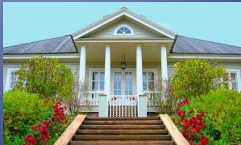
Пушкин в селе Михайловском