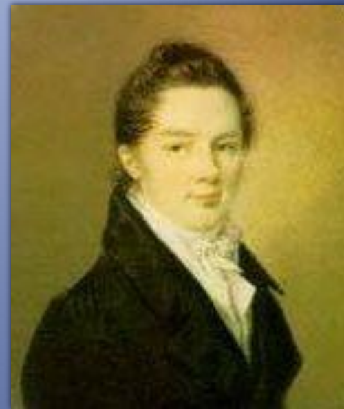
Иван Иванович Пушин

Пушкин сохранил лицейскую дружбу и культ Лицея на всю жизнь.