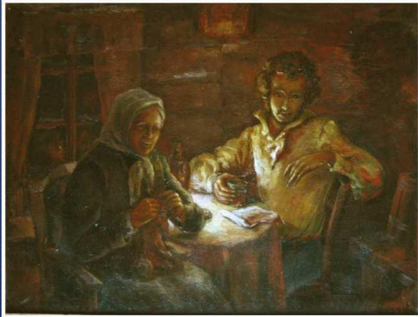
Иллюстрация к стихотворению «Зимний вечер»

Забота и любовь Арины Родионовны скрашивали поэту ссылку. Пушкин по- настоящему крепко любил свою няню и написал несколько трогательных стихотворений, к ней обращенных, такое как «Зимний вечер»