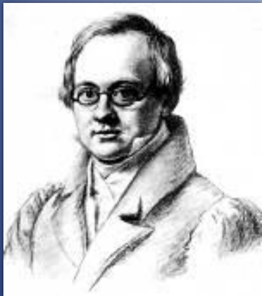
АНТОН АНТОНОВИЧ Дельви́г