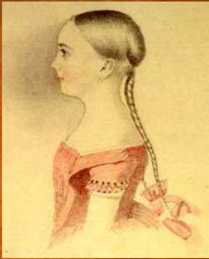
Старшая дочь, Мария Александровна Пушкина (1832-1919г.)