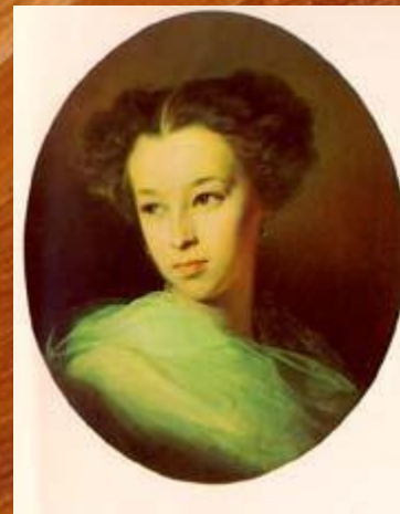
Младшая дочь, Наталья Александровна Пушкина (1836-1913г.)