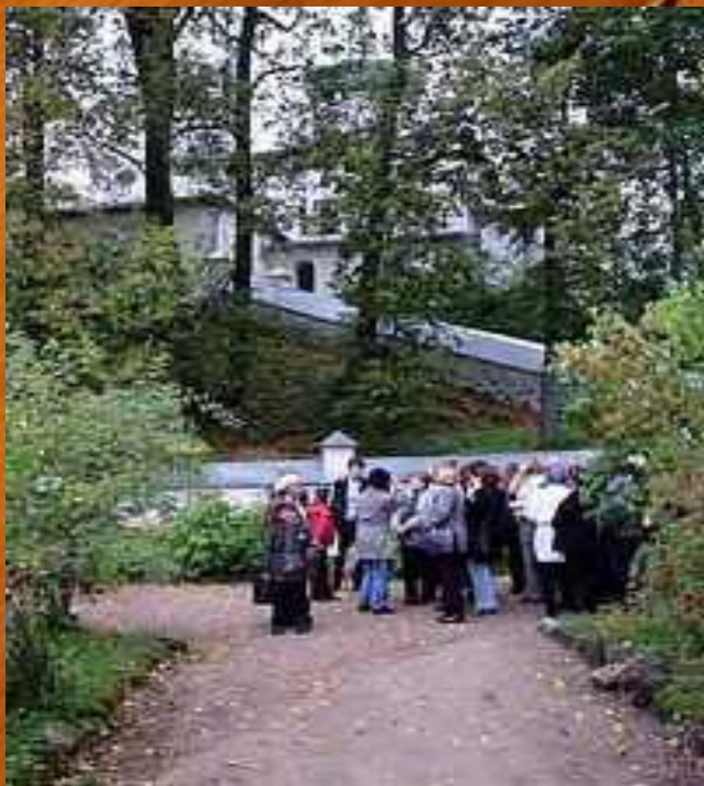
Святогорский монастырь. Могила Пушкина находится у подножия храма

. В 2 часа 29 января (по новому стилю 10 февраля) 1837 года он умер. 5 февраля Пушкин был перевезен в село Михайловское и погребен у Святогорского монастыря.