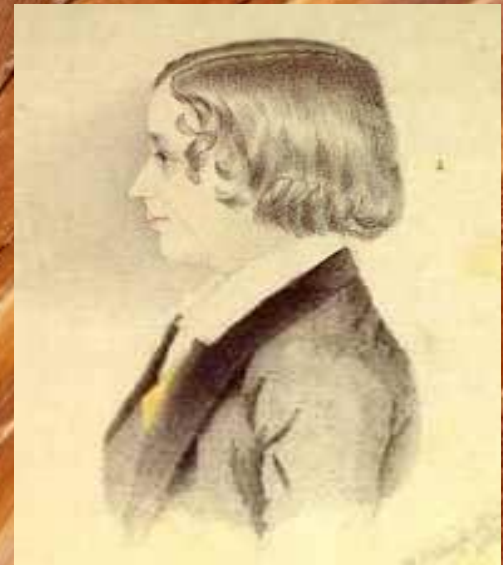
Старший сын, Александр Александрович Пушкин (1833-1914г.)