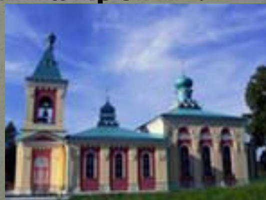
храм Преображения Господня.