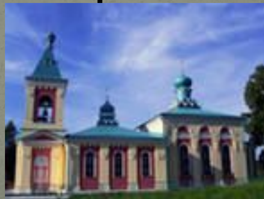
храм Преображения Господня.