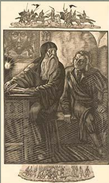
В.А.Фаворский. «Борис Годунов». Фронтиспис к неосуществленному изданию. 1940 г. Бумага, гравюра на дереве.