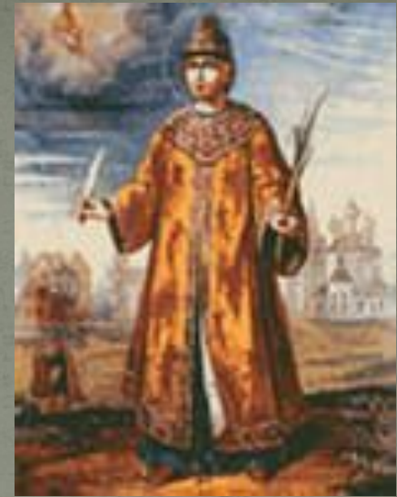
Дмитрий, сын Ивана Грозного

После Ивана Грозного остался ещё один сын, маленький царевич Дмитрий. Который вместе с матерью был отправлен в город Углич на Волге. Здесь в 1591 г. произошли страшные события, тайна которых не разгадана до сих пор. 8-летний царевич, страдавший от припадков эпилепсии (или, как тогда говорили, «падучей»), играя с ребяташками в ножички (?), неожиданно стал биться, кататься по земле и сам себя убил ножом. По крайней мере, так гласила официальная версия.