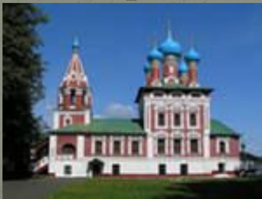
«церковь царевича Дмитрия на крови»

В Угличе, на месте убиения святого царевича Дмитрия, был построен храм его имени, который в народе получил название «церковь царевича Дмитрия на крови».