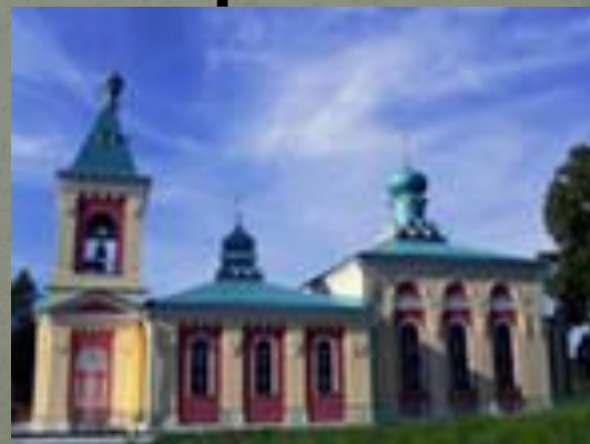
храм Преображения Господня.