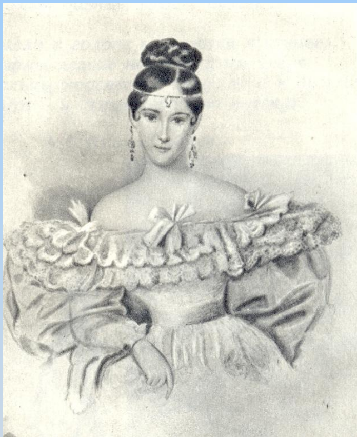
Н.Н.Пушкина А.П.Брюлов. Акварель 1831-1832 гг.

Зимой 1828-1829 годов на одном из московских балов Пушкин познакомился с Натальей Николаевной Гончаровой.