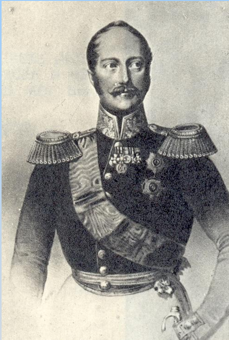
Николай I. Литография Шевалье. 1830-1840 гг.

В самом конце 1833 года Пушкину было «пожаловано» первое придворное звание камер-юнкера, которое обычно давалось совсем молодым людям. Пушкин был взбешен царской «милостью».