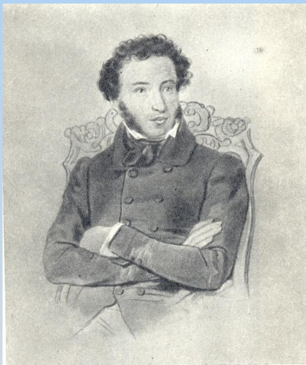
ПУШКИН П.Ф.Соколов. Акварель 1830-1836

Снова тучи надо мною Собралися в тишине; Рок завистливый бедою Угрожает снова мне... Сохраню ль к судьбе презренье? Понесу ль навстречу ей Непреклонность и терпенье Гордой юности моей?