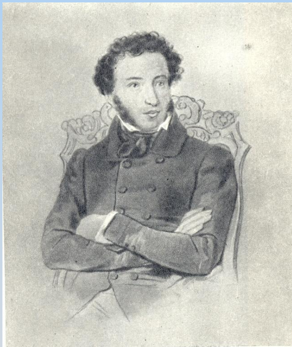
ПУШКИН П.Ф.Соколов. Акварель 1830-1836

Снова тучи надо мною Собралися в тишине; Рок завистливый бедою Угрожает снова мне... Сохраню ль к судьбе презренье? Понесу ль навстречу ей Непреклонность и терпенье Гордой юности моей?