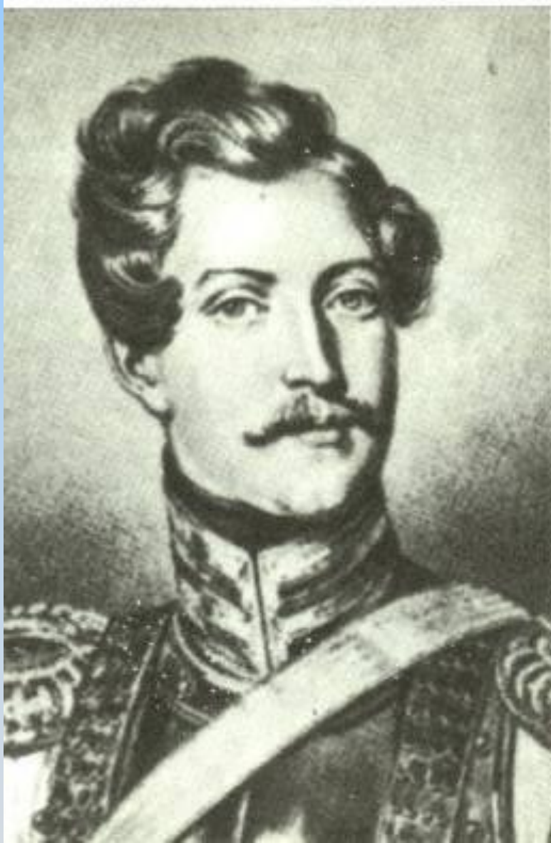
Ж.Дантес Т.Райт. Акварель 1830 г.

Молодой француз Жорж Дантес неясного происхождения, ловкий авантюрист, встретивший самый благосклонный прием в петербургском обществе стал открыто и настойчиво ухаживать за Натальей Николаевной.