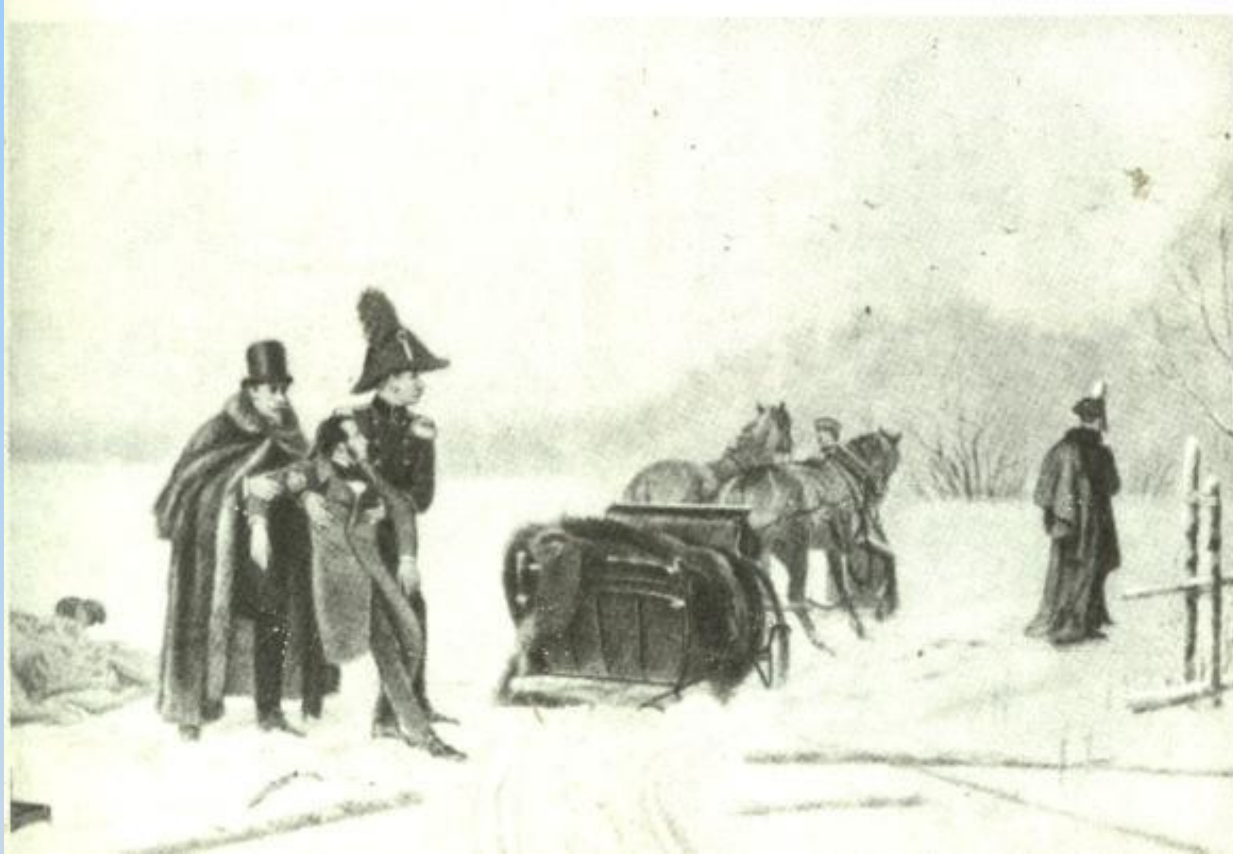
Дуэль Пушкина с Дантесом

Утром 27 января 1837 года Пушкин еще работал: писал, занимался делами «Современника»; внешне он был спокоен, даже весел. Короткий зимний день уже клонился к вечеру, когда Пушкин и его секундант К.К.Данзас отправились на Черную речку – недалекий пригород Петербурга, где была назначена дуэль.