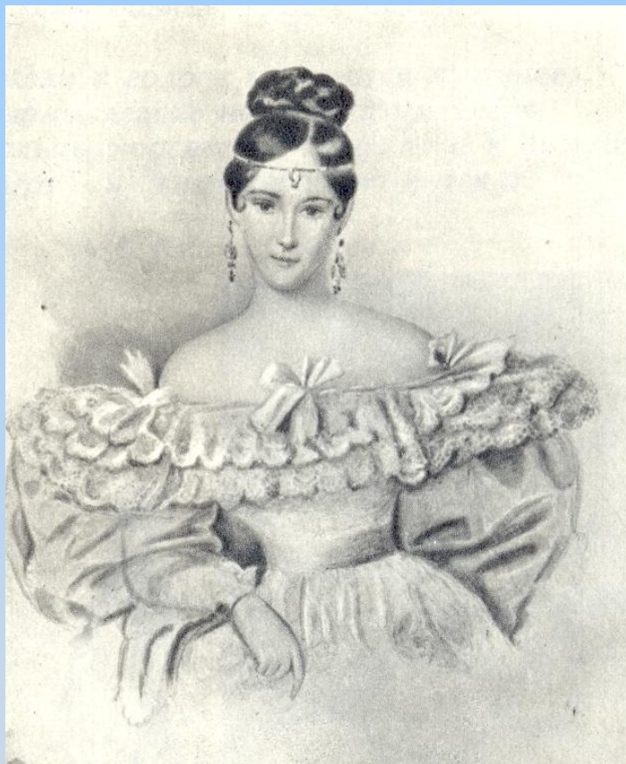
Н.Н.Пушкина А.П.Брюлов. Акварель 1831-1832 гг.

Зимой 1828-1829 годов на одном из московских балов Пушкин познакомился с Натальей Николаевной Гончаровой.