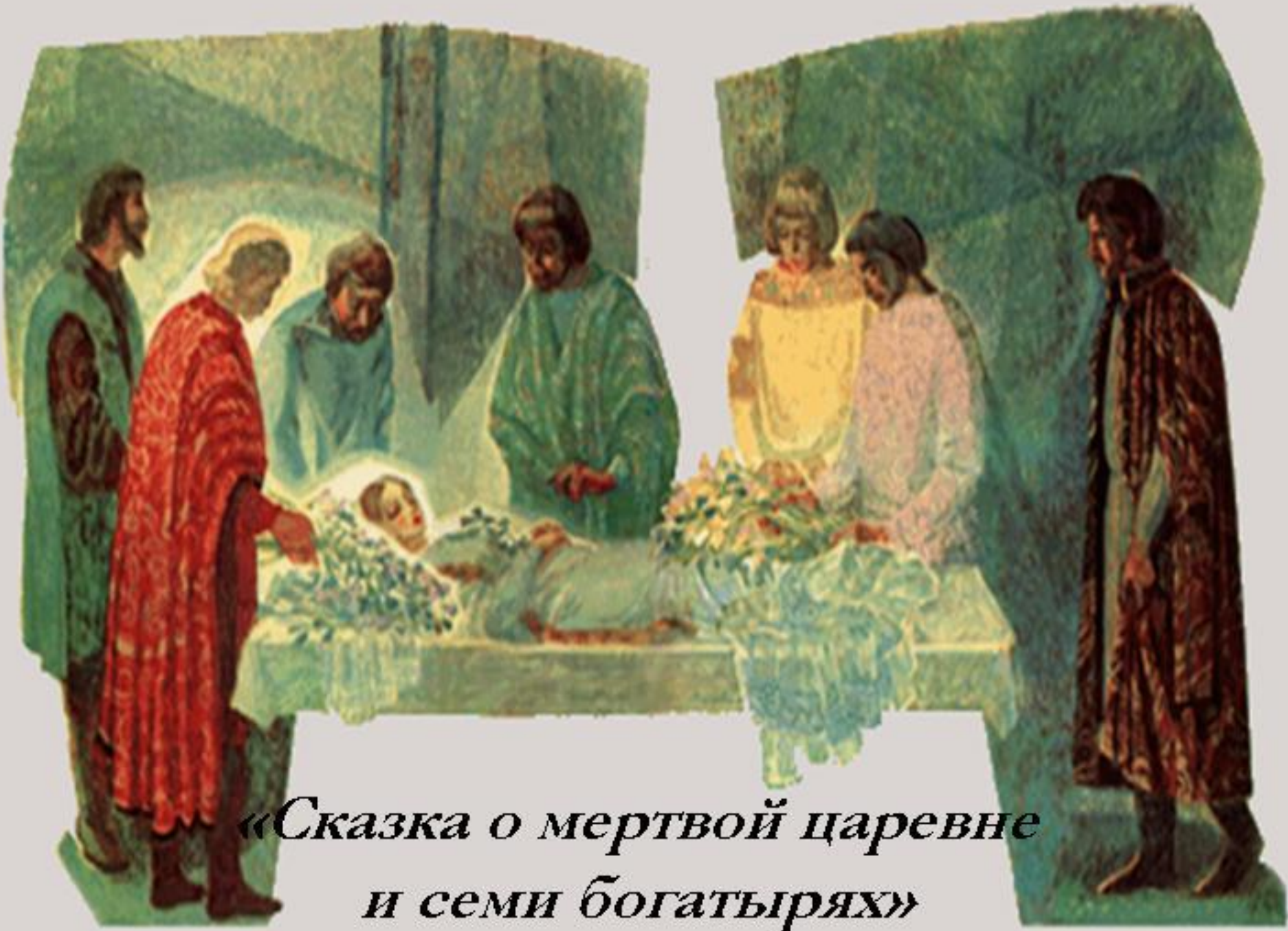
«Сказка о мертвой царевне и семи богатырях»