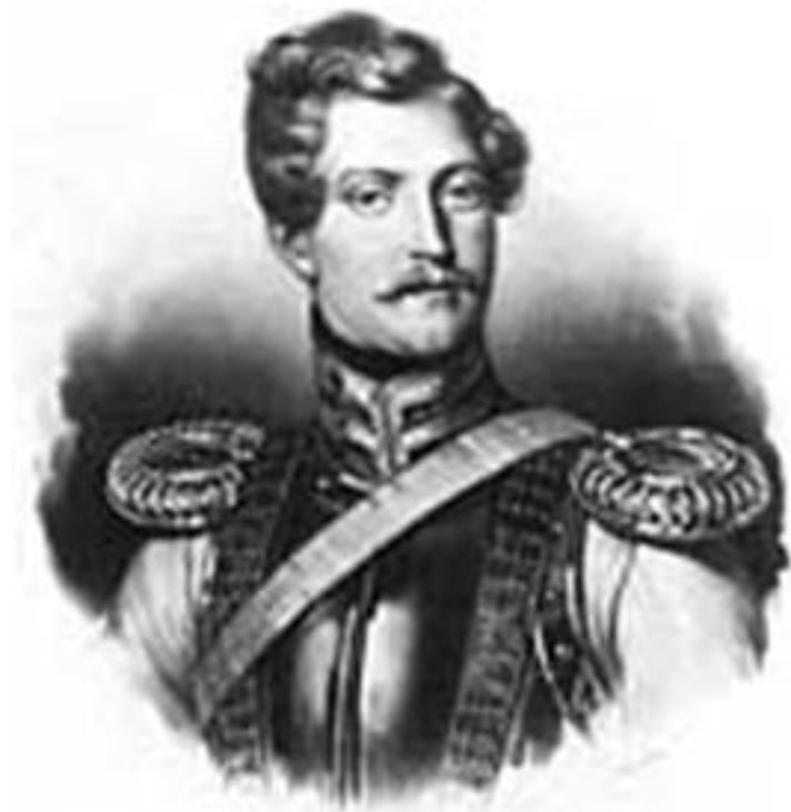
Ж. Дантес-Геккерн. 1830-е гг.

В начале 1834 г. в Петербурге появился француз барон Дантес.