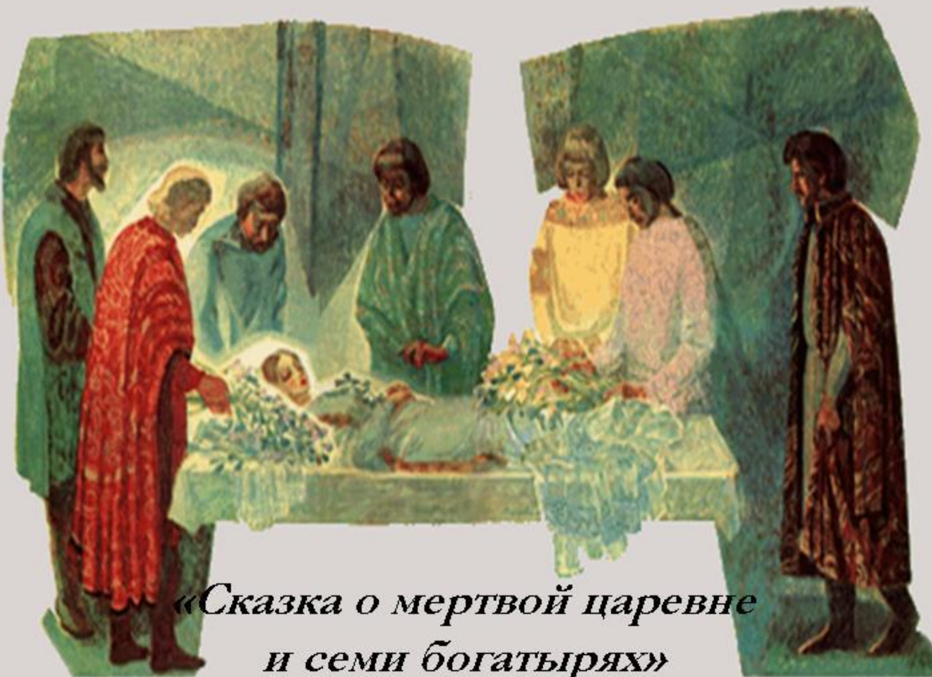
«Сказка о мертвой царевне и семи богатырях»