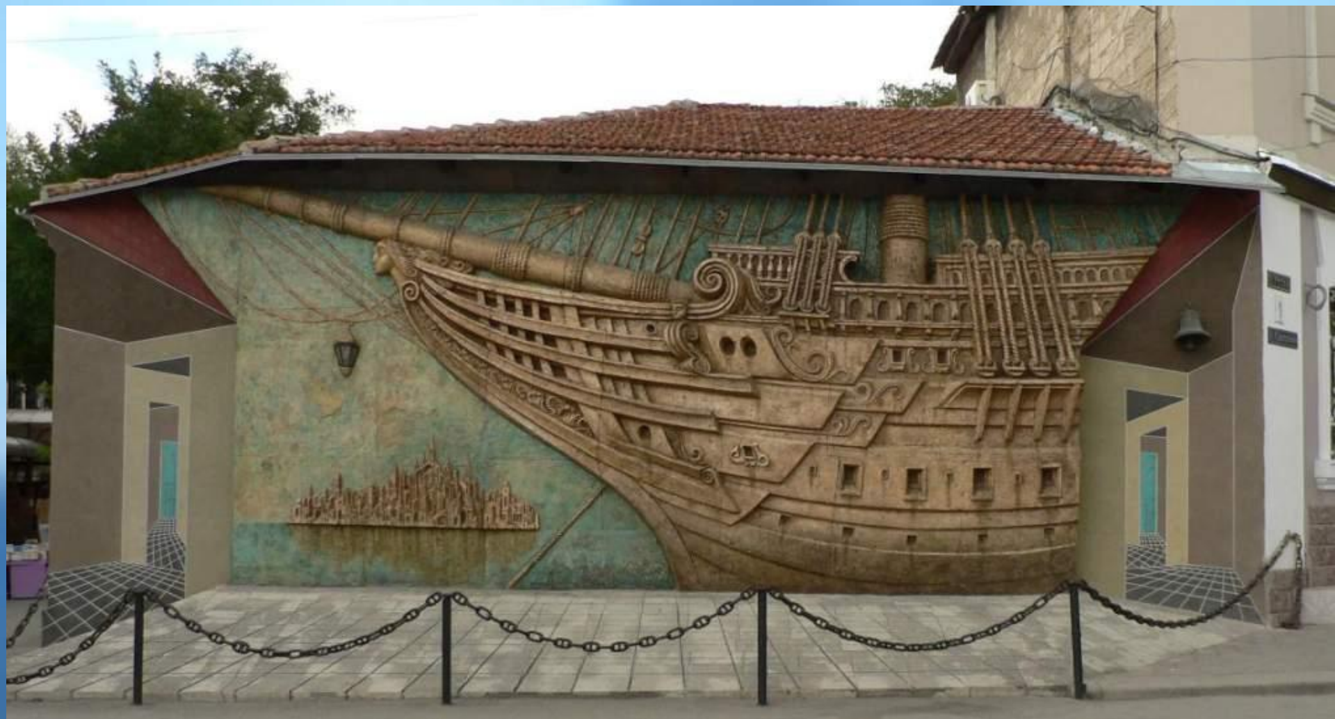
Стена дома Грина