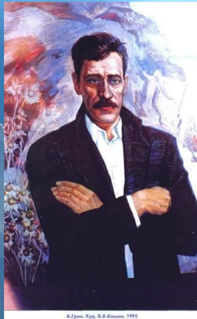
А.Грин. Худ. В.А.Кашин. 1995