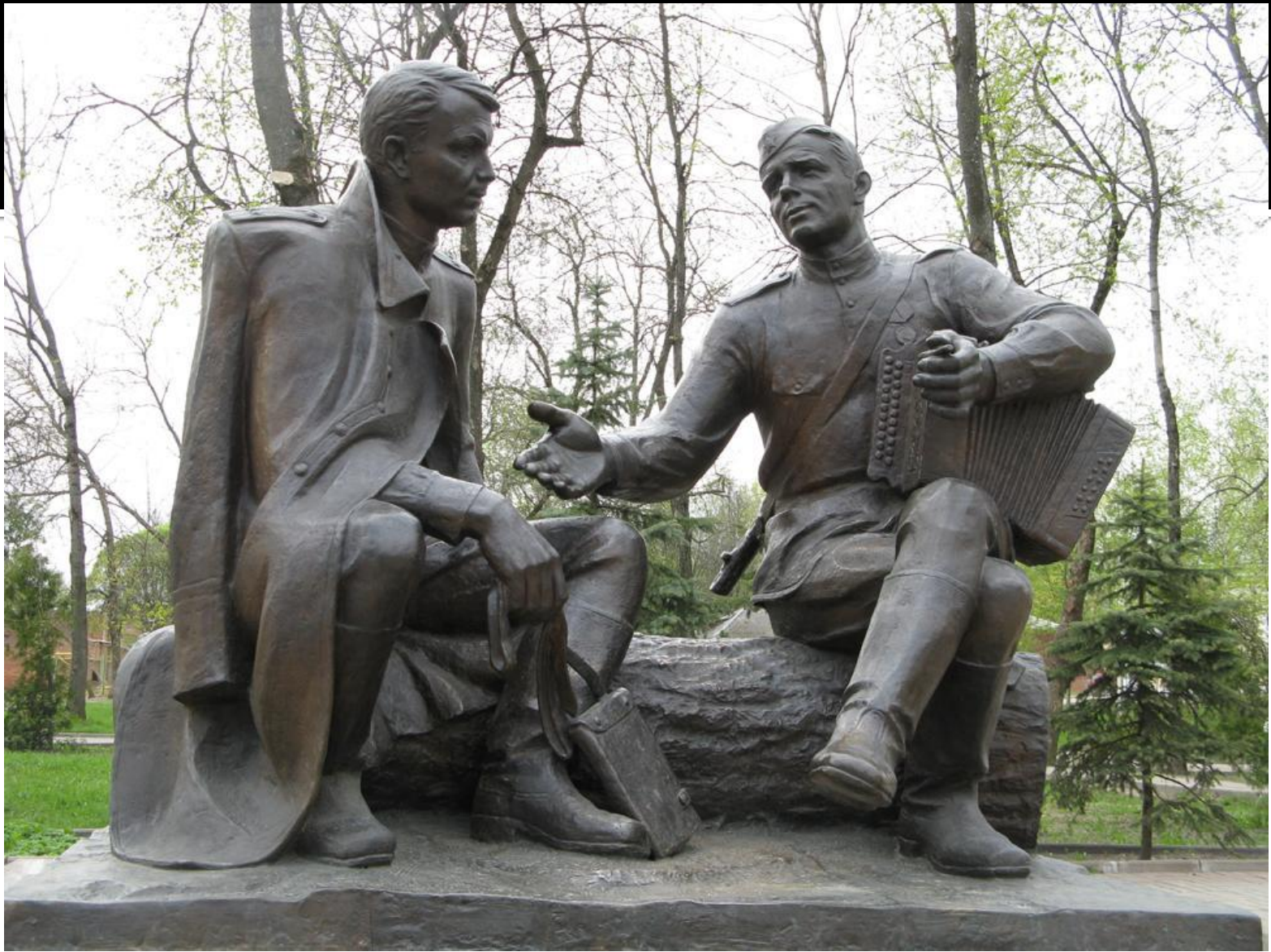
Александр Твардовский и Василий Тёркин