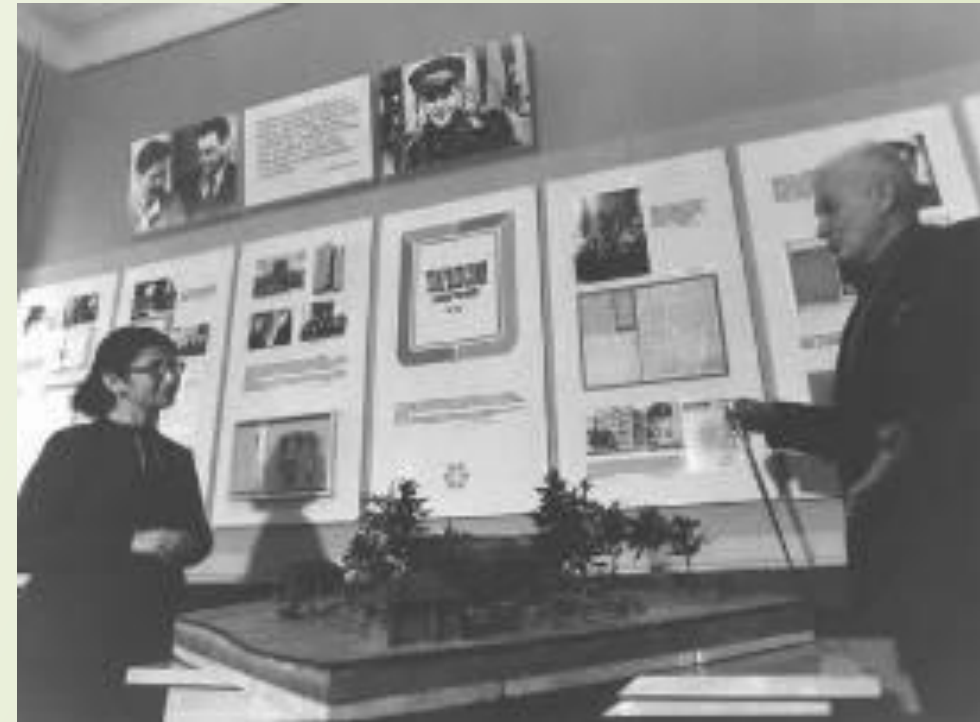
Хутор Загорье, музей А.Т. Твардовского

В 1988 году открыт для посетителей возрожденный хутор Загорье, место, где родился и жил до восемнадцатилетнего возраста А. Т. Твардовский – выдающийся советский поэт. По макету брата поэта Ивана Трифионовича были заново возведены: дом, сарай, баня, кузница и другие надворные постройки, разбит сад и огород. Представленная в интерьере дома мебель тоже выполнена руками брата поэта - мастера – краснодеревщика. Большую помощь в оформлении дома, хозяйственных помещений, кузницы оказали жители деревень, передавшие музею предметы - быта, характерные для того времени. Неброская русская природа и обстановка, окружавшая мальчика, позволяют проникнуться атмосферой, в которой зарождался талант будущего поэта. Ежегодно, в день рождения поэта, на хуторе Загорье проводятся литературные праздники.