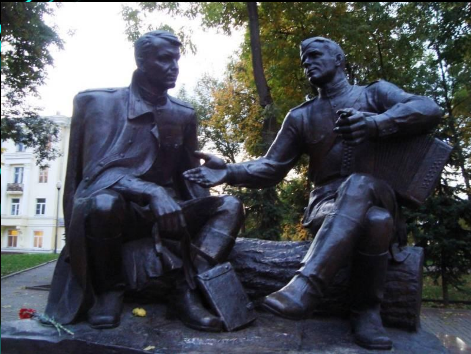
Памятник Твардовскому и Тёркину