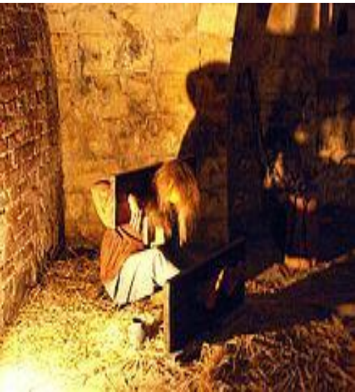
Пытки времен опричнины

Наиболее жестоким был опричник Малюта Скуратов, самым приближенным к царю - боярин Алексей Басманов, князь Афанасий Вяземский.