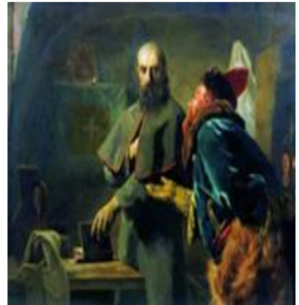
Малюта Скуратов во время пыток