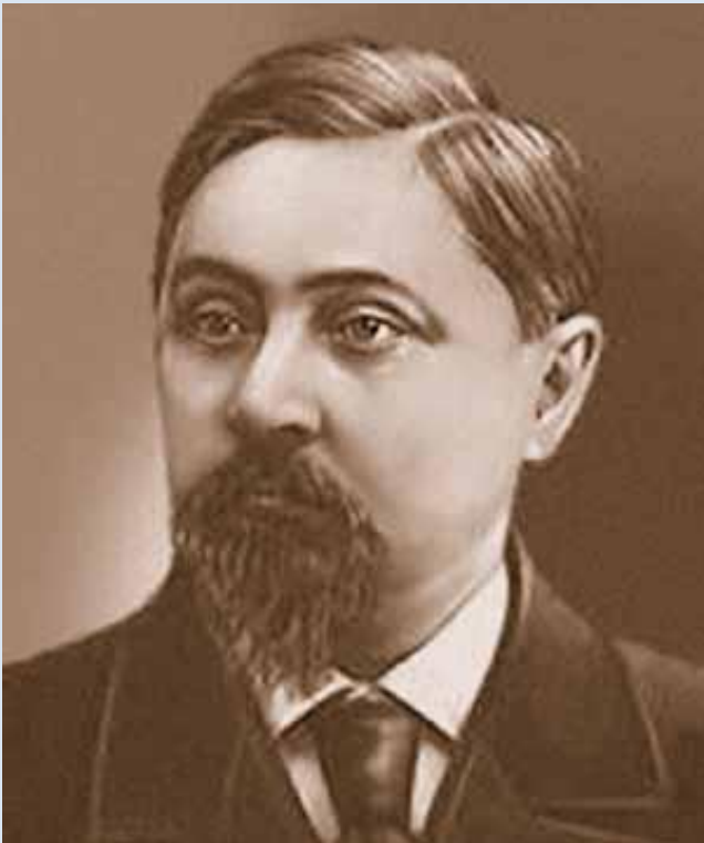
Дмитрий Наркисович Мамин - Сибиряк