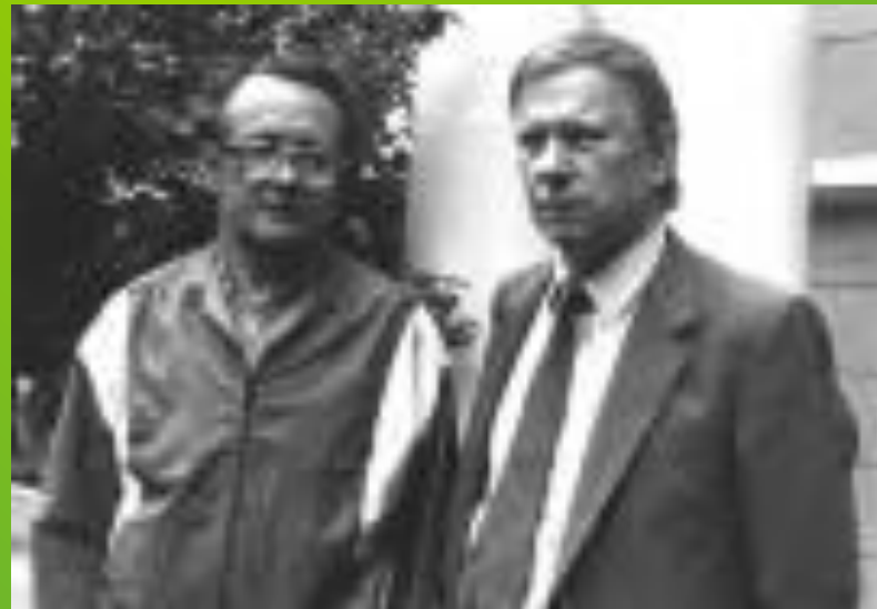
А.Адамович и В.Быков

Премия «За честь и мужество таланта» (1997; посмертно).