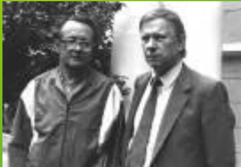
А.Адамович и В.Быков

Премия «За честь и мужество таланта» (1997; посмертно).