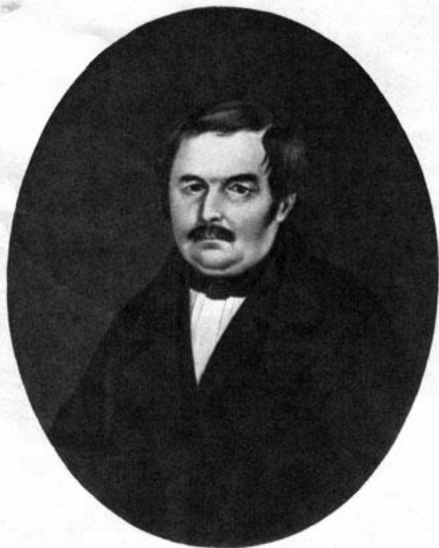
ОТЕЦ ПИСАТЕЛЯ, В. А. ГОГОЛЬ-ЯНОВСКИЙ. Работа неизвестного художника.