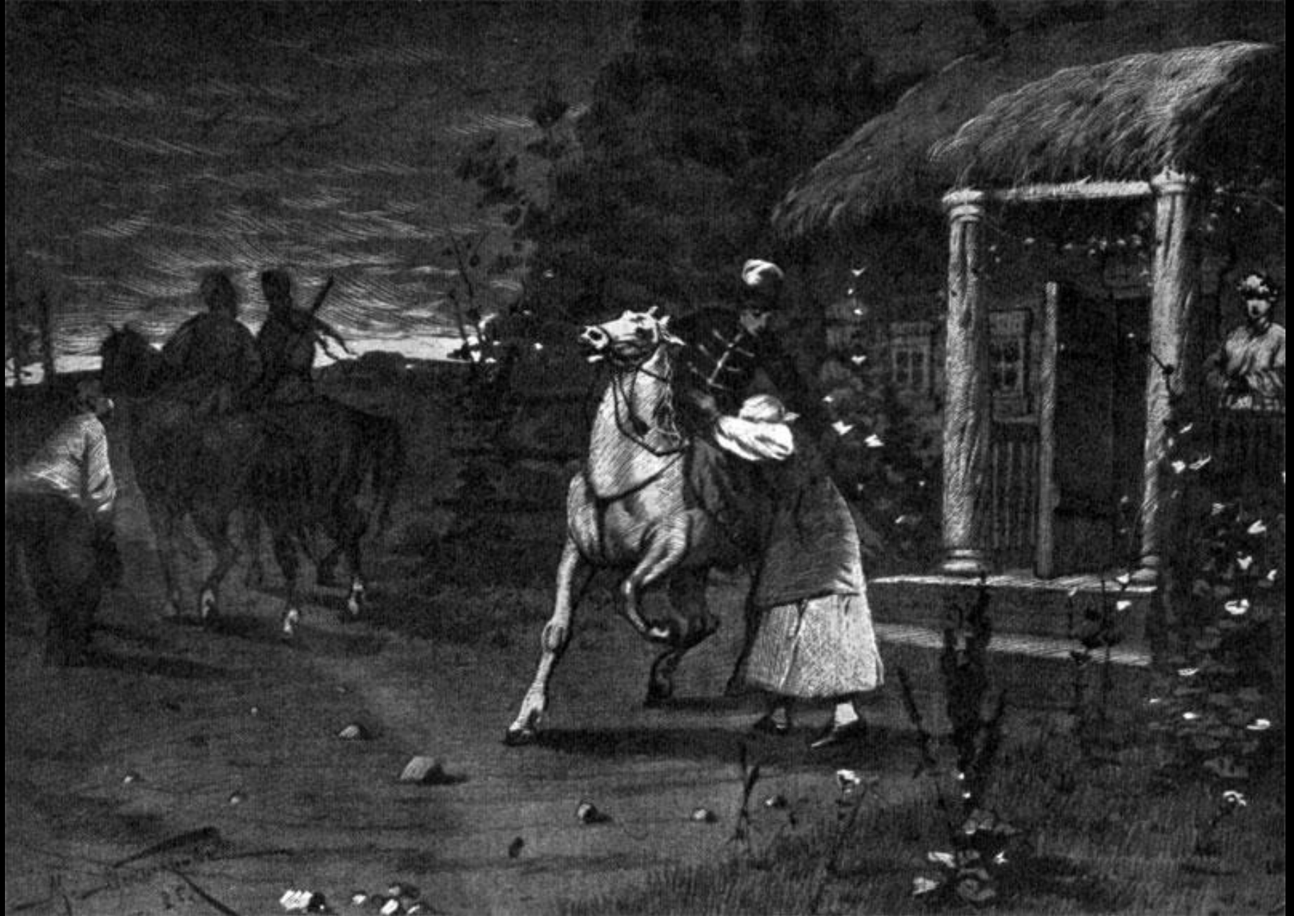
Отъезд Тараса Бульбы с сыновьями.