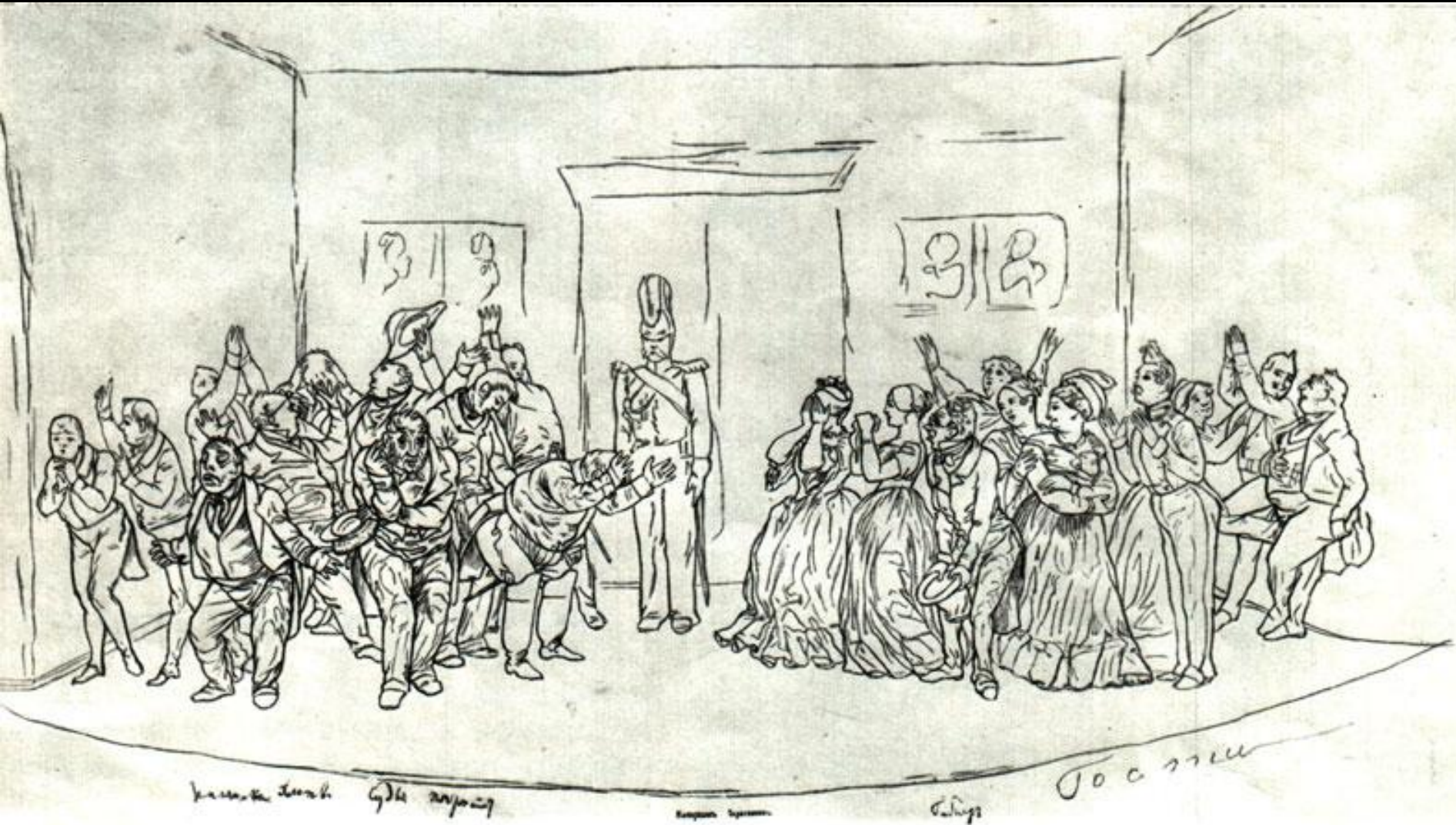
«РЕВИЗОР». ЗАКЛЮЧИТЕЛЬНАЯ СЦЕНА. Рисунок Н. В. Гоголя (?)