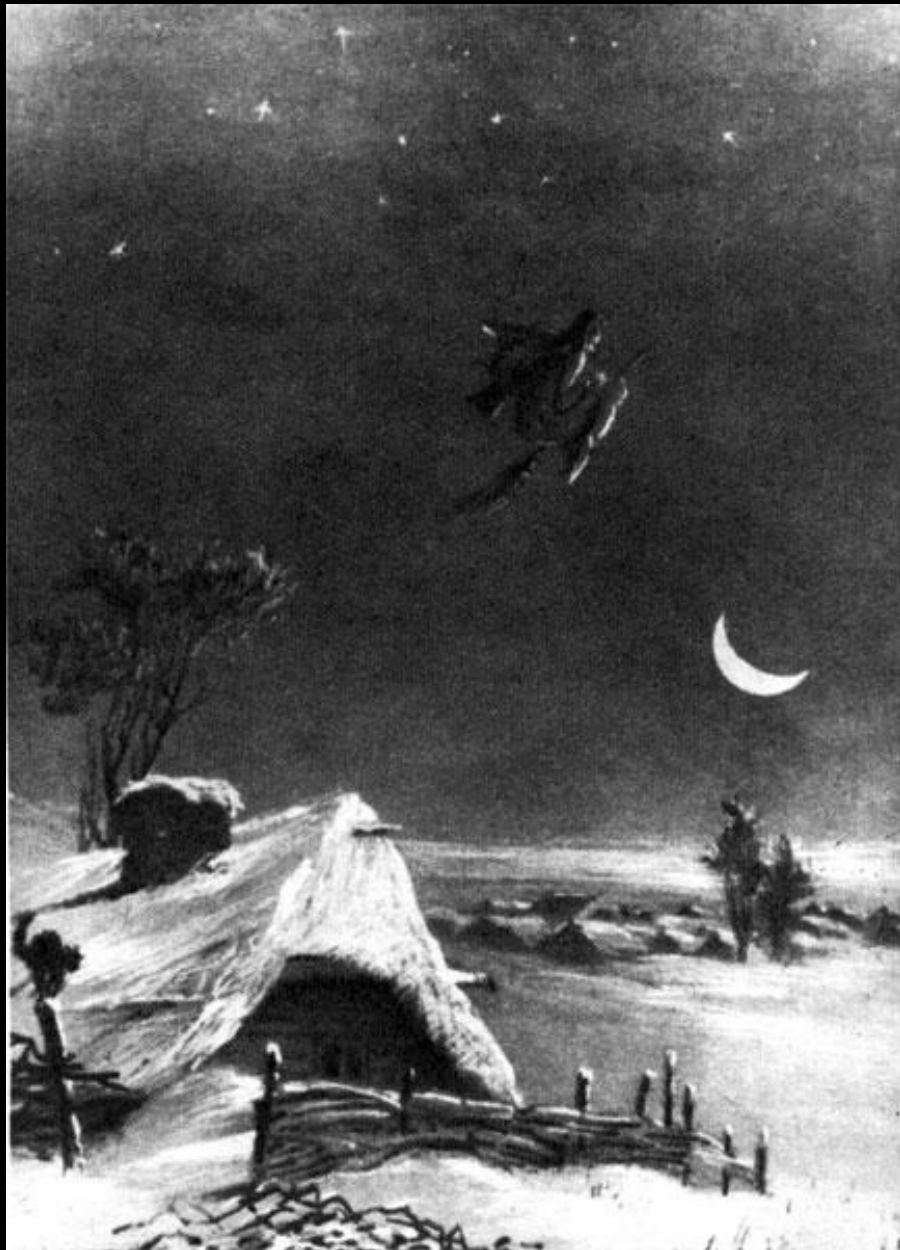
«Ночь перед Рождеством»