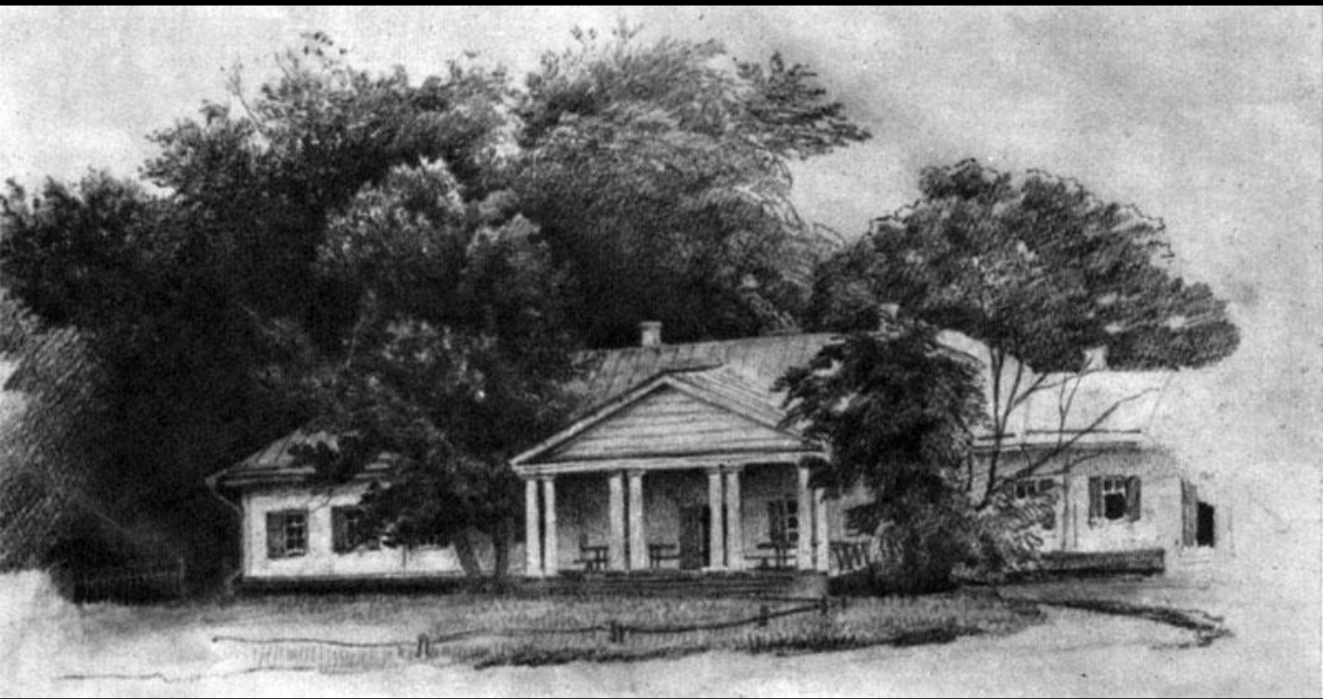
Дом в Васильевке