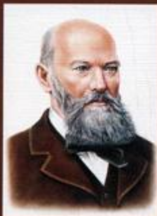
А. Н. Островский

русская литература произведения школьной программы