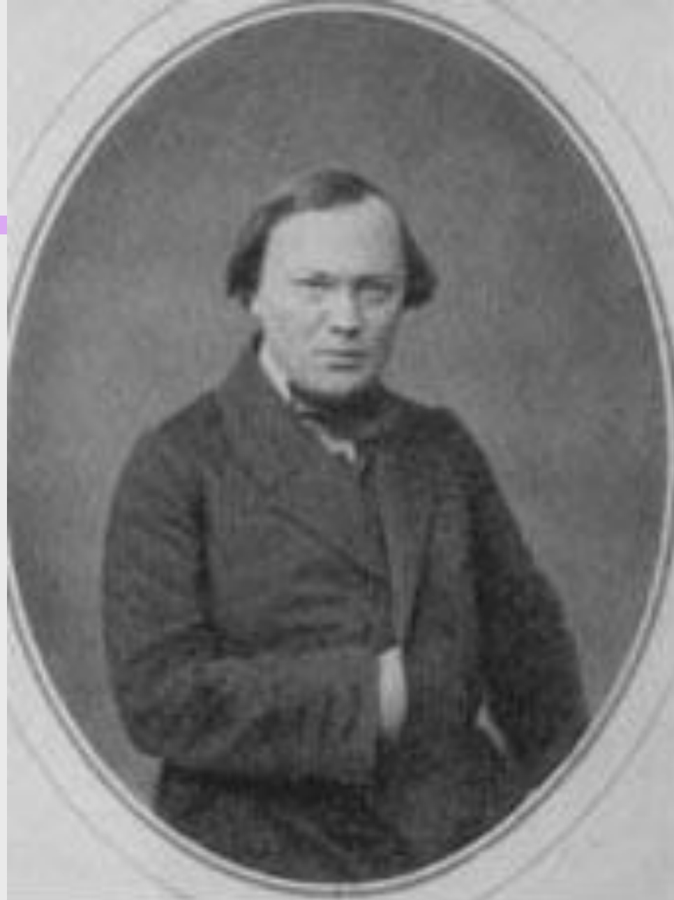
Александр Николаевич Островский