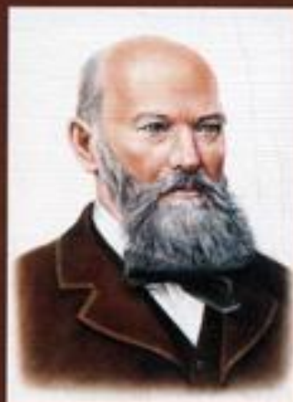
А. Н. Островский

русская литература произведения школьной программы