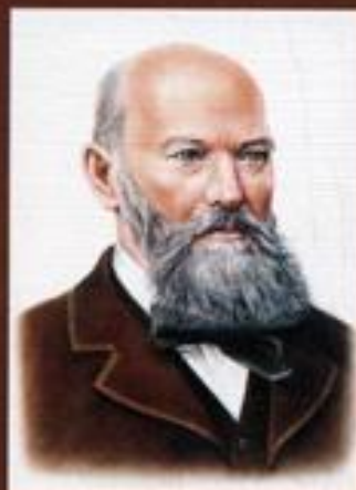
А. Н. Островский

русская литература произведения школьной программы