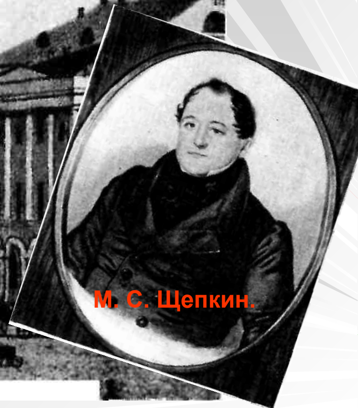
М. С. Щепкин.