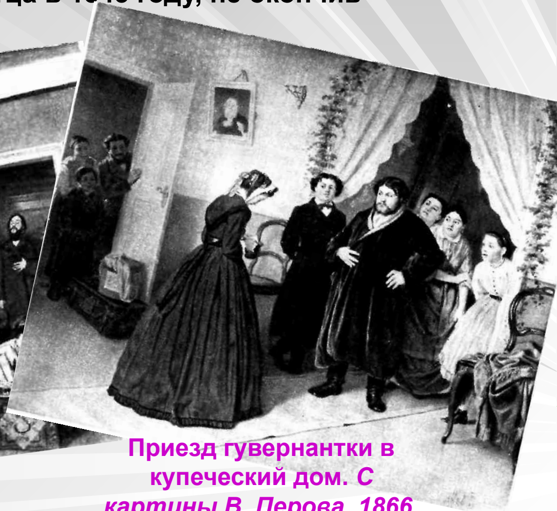
Приезд гувернантки в купеческий дом. С картины В. Перова. 1866.