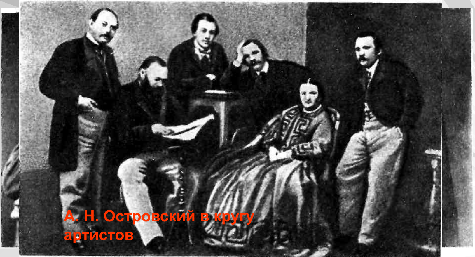
А. Н. Островский в кругу артистов

Считая специальную подготовку воспитания и обучения актера «делом государственной важности», А. Н. Островский в 1865 году вместе с композитором Н. Г. Рубинштейном организует Артистический кружок. Кружок дал русскому театру М. П. Садовского, О. О. Садовскую, В. А. Макшеева. Здесь «впервые познакомилась московская публика с огромным талантом П. А. Стрепетовой».