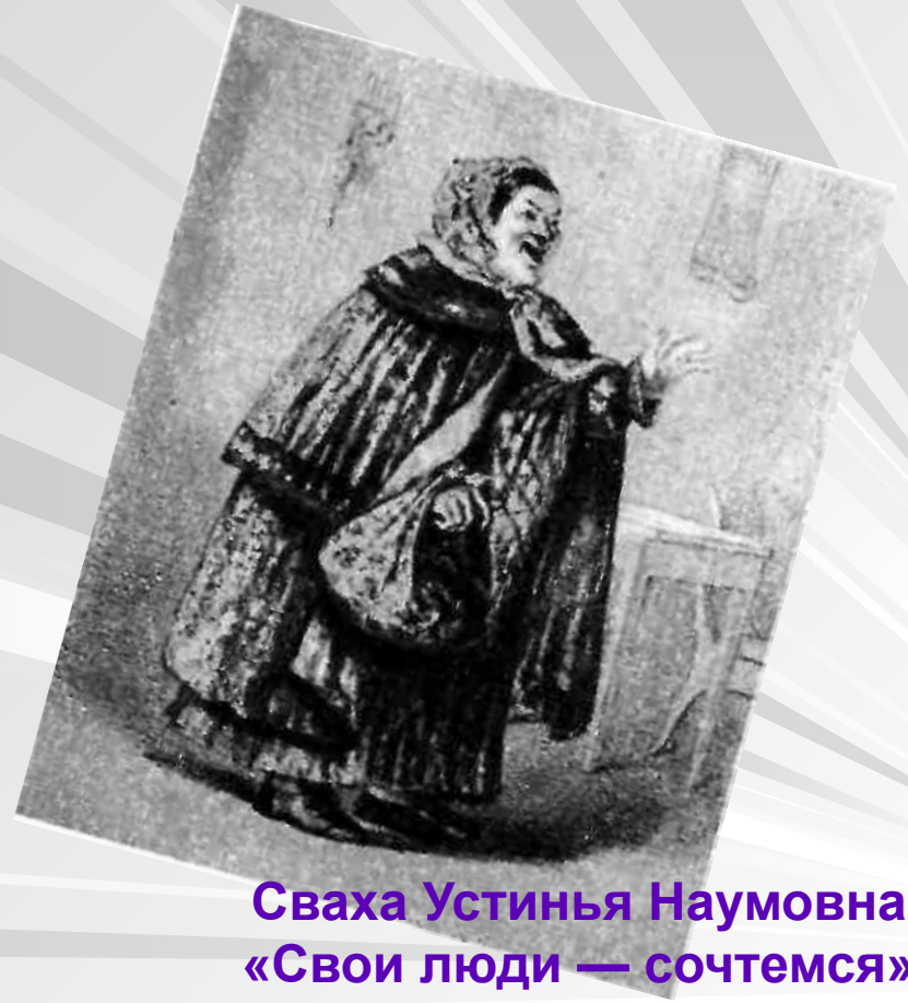
Сваха Устинья Наумовна. «Свои люди — сочтемся». С рисунка Я. Боклевского. 1859.