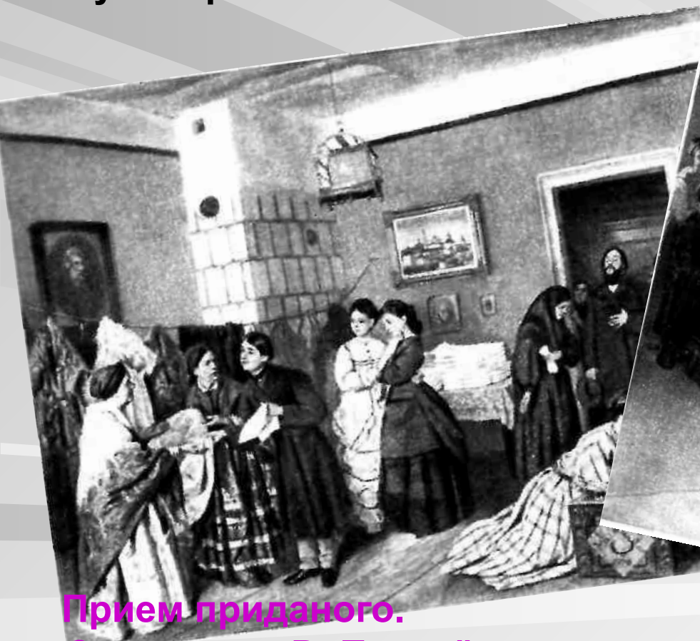
Прием приданого. С картины В. Пукирёва.

А. Н. Островский, с детства наблюдавший жизнь купцов, в совершенстве изучил быт, семейные и имущественные отношения их во время почти восьмилетней службы в Московском совестном, а затем Коммерческом суде, куда поступил по настоянию отца в 1843 году, не окончив университета