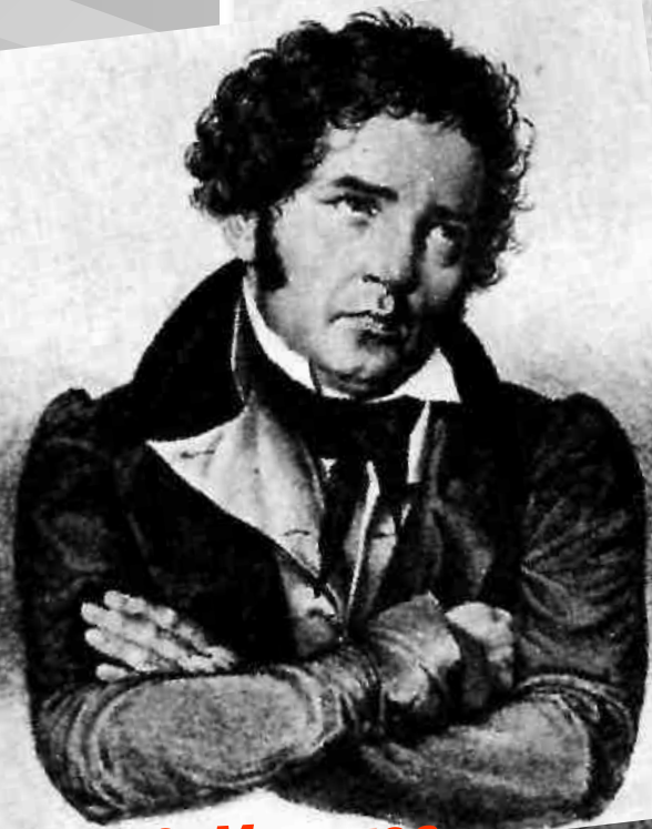
П. С. Мочалов