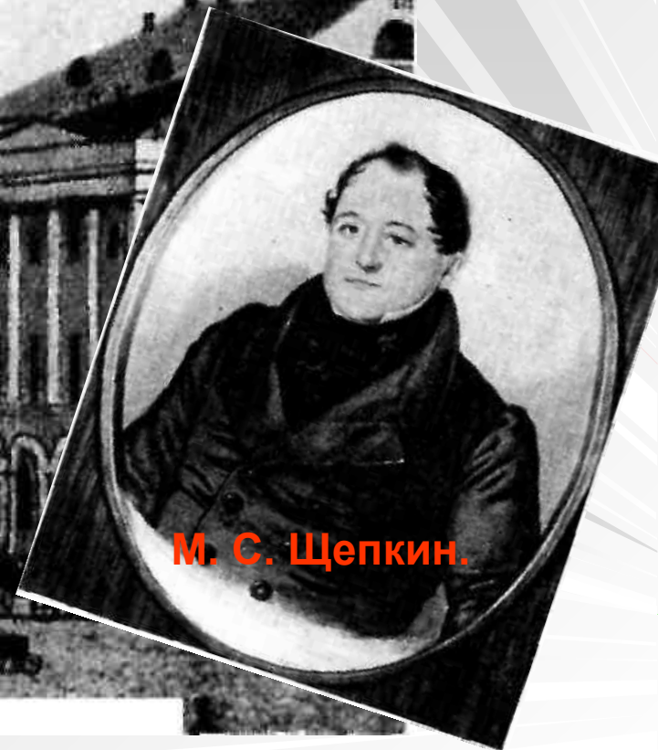
М. С. Щепкин.