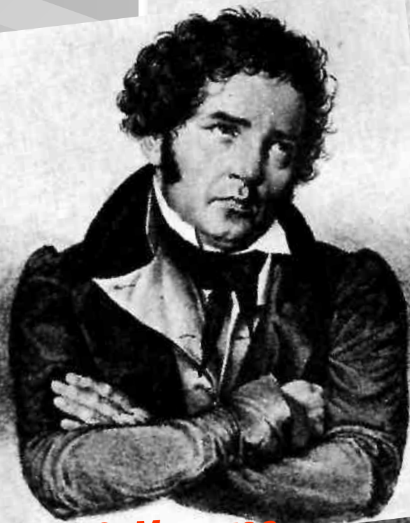
П. С. Мочалов