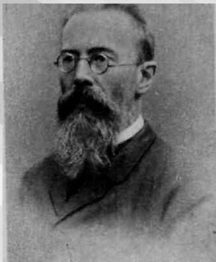
Композитор Н. А. Римский-Корсаков. 1900