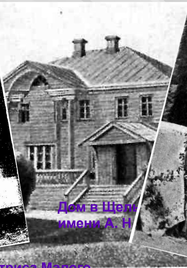
Дом в Щелы имени А. Н.