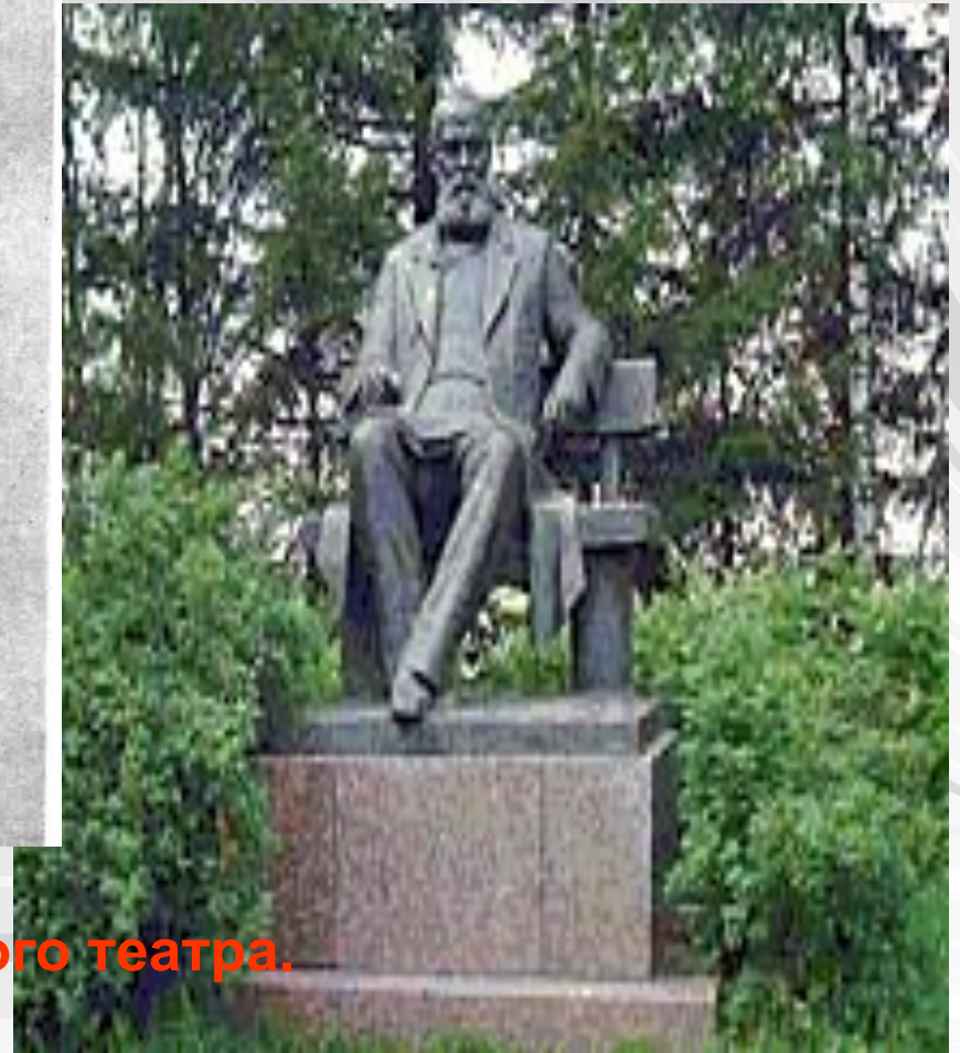
Памятник А.Н, Островскому у Малого театра. Скульптор А.Андреев