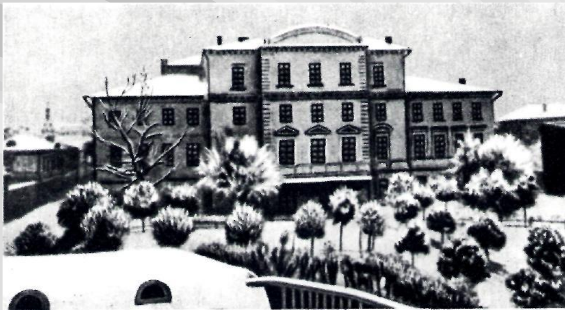
Первая московская гимназия, где учился А. Н. Островский.

Еще в гимназии он увлекается литературой, и первые опыты его литературного творчества относятся к гимназическому времени.