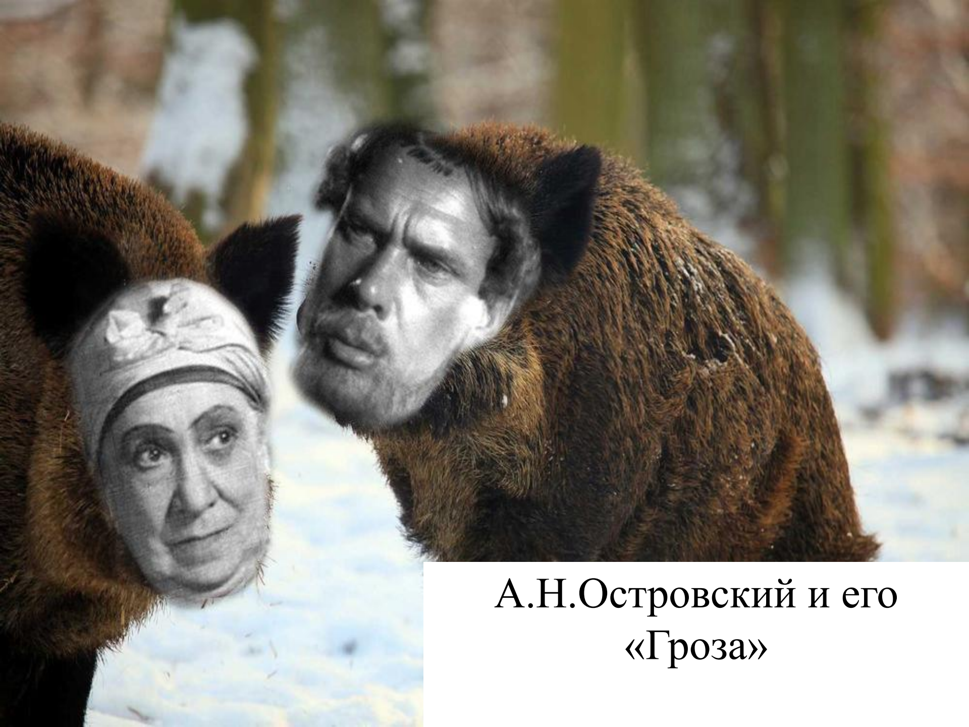
А.Н.Островский и его «Гроза»