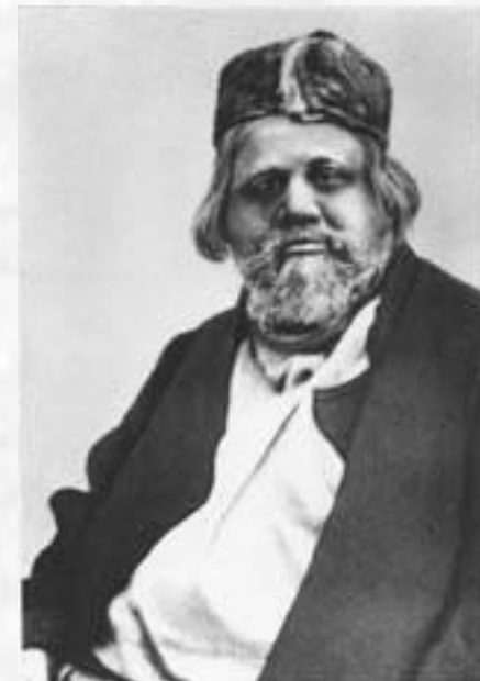
«Снегурочка» Бобмель — В. И. Давыдов Петербург, Александринский театр