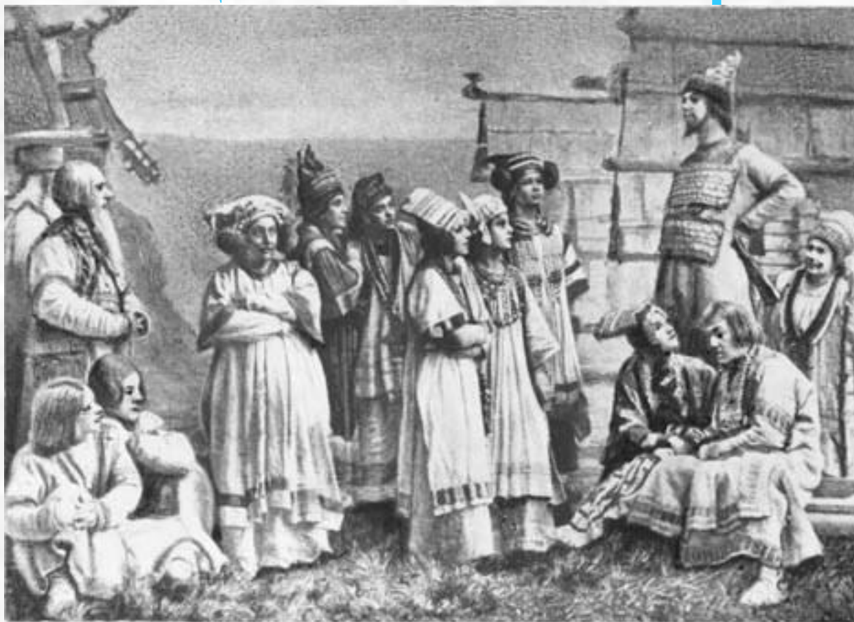
«Снегурочка». I-е действие