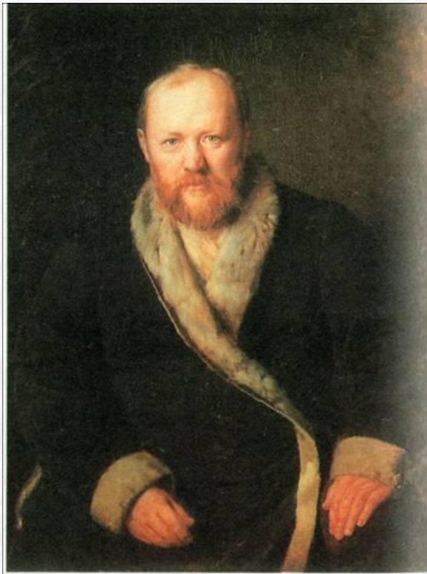
А. Н. Островский. Портрет художника В. Г. Перова