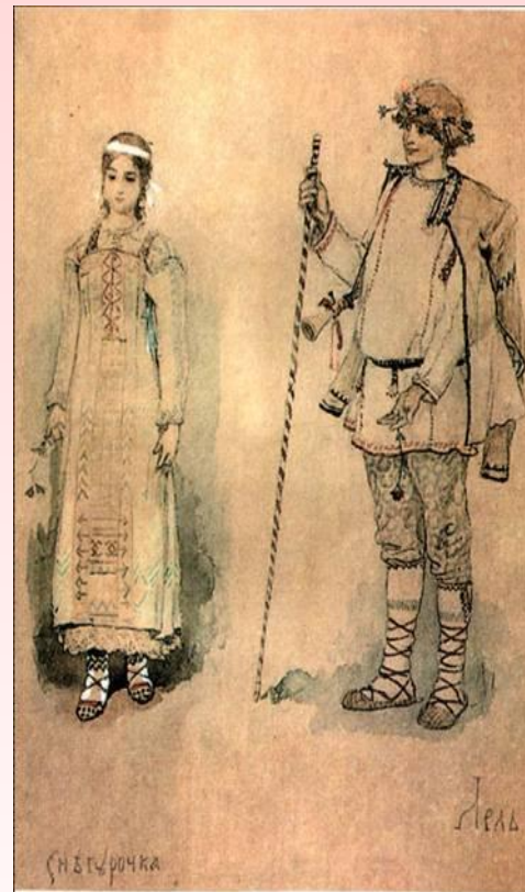
Снегурочка и Лель