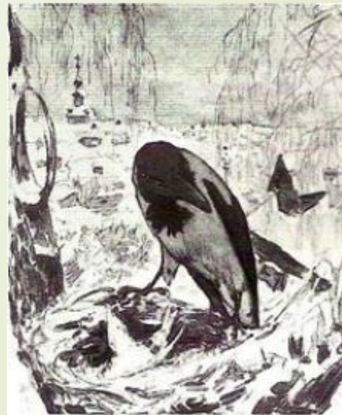
Иллюстрации В. Серова