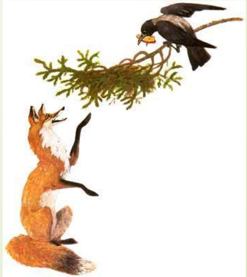
Иллюстрации С. Ярового