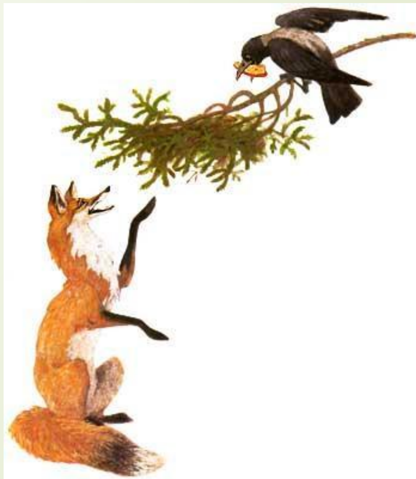
Иллюстрации С. Ярового