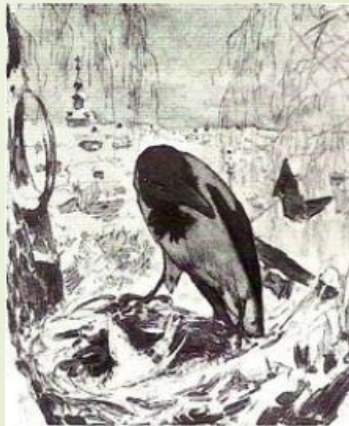
Иллюстрации В. Серова