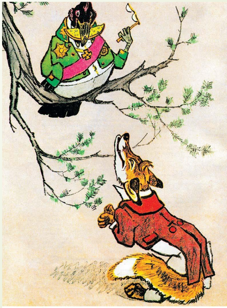
Иллюстрация Е.М. Рачева.