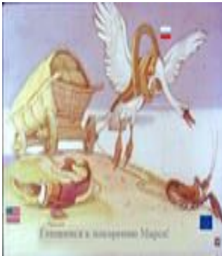
«Лебедь, рак и щука»