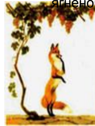
«Лисица и виноград»