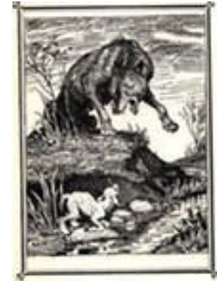
«Волк и ягненок»