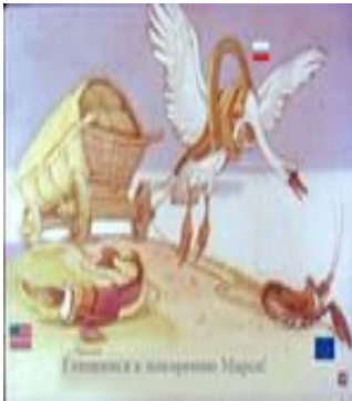
«Лебедь, рак и щука»