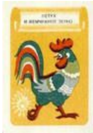
«Петух и бобовое зернышко»