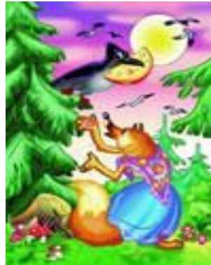
«Ворона и лисица»