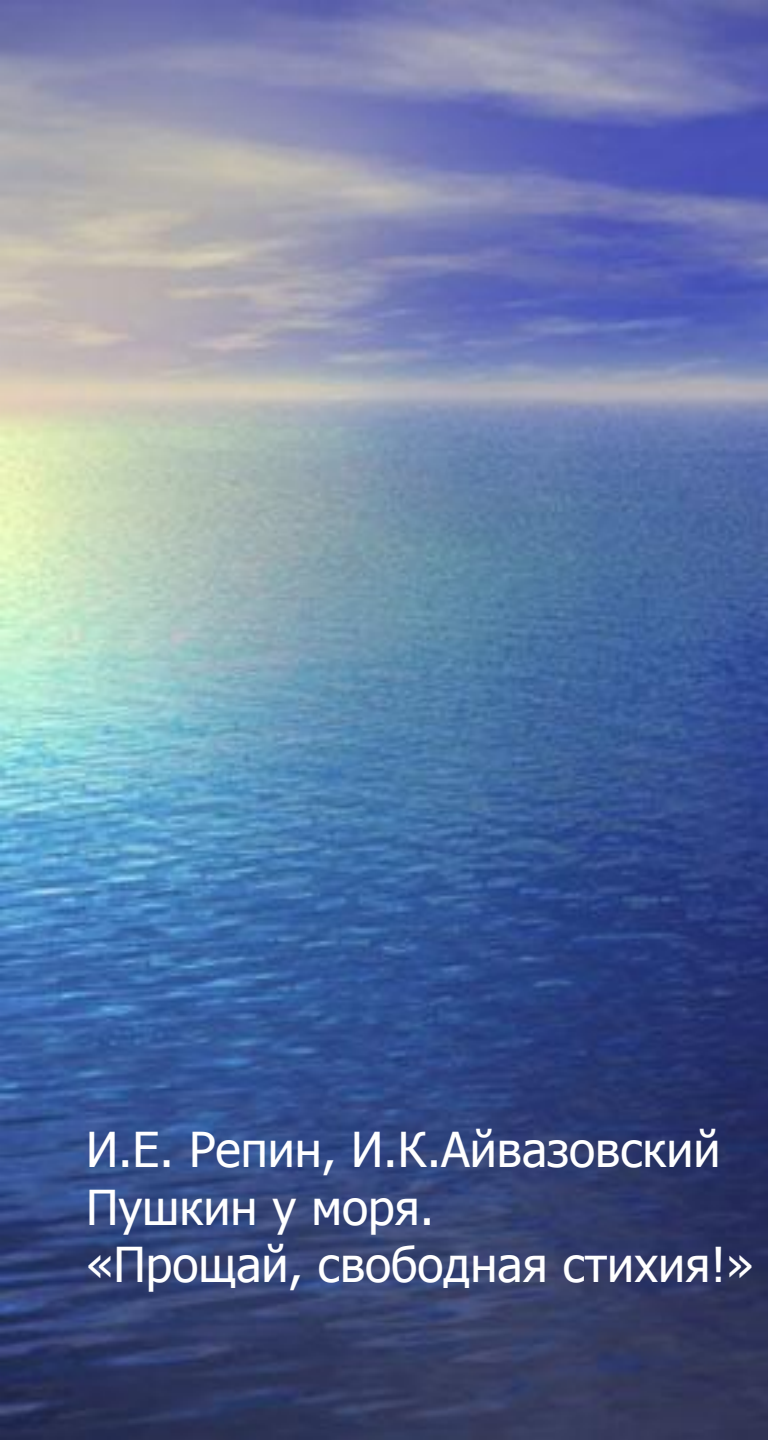
И.Е. Репин, И.К.Айвазовский Пушкин у моря. «Прощай, свободная стихия!»