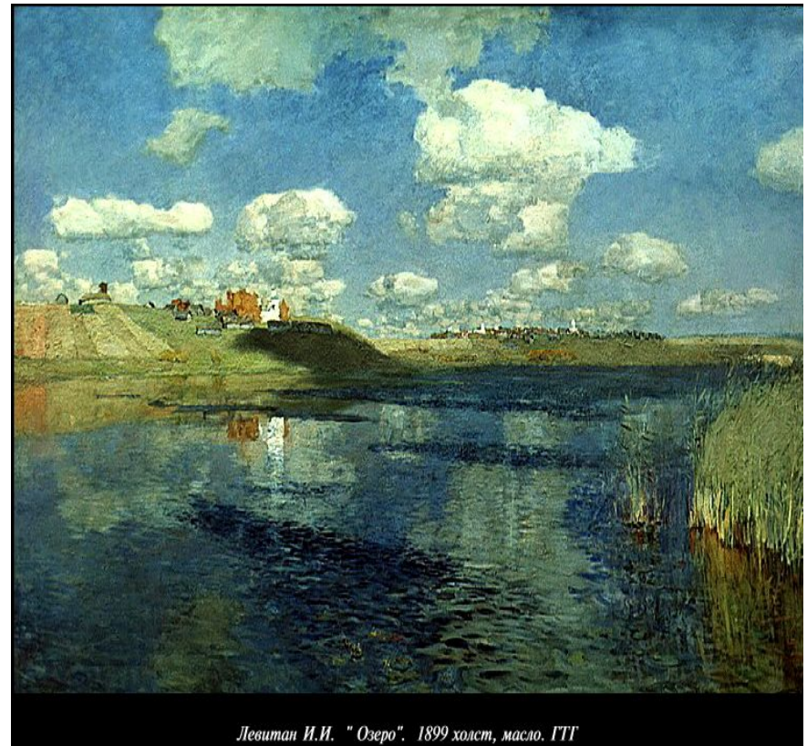
Левитан И.И. "Озеро". 1899 холст, масло. ГТГ