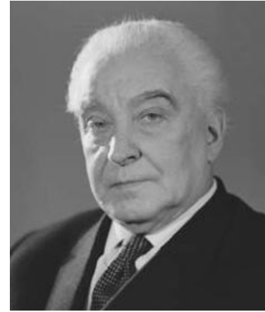
ВИНОГРАДОВ Виктор Владимирович [1880-1944]