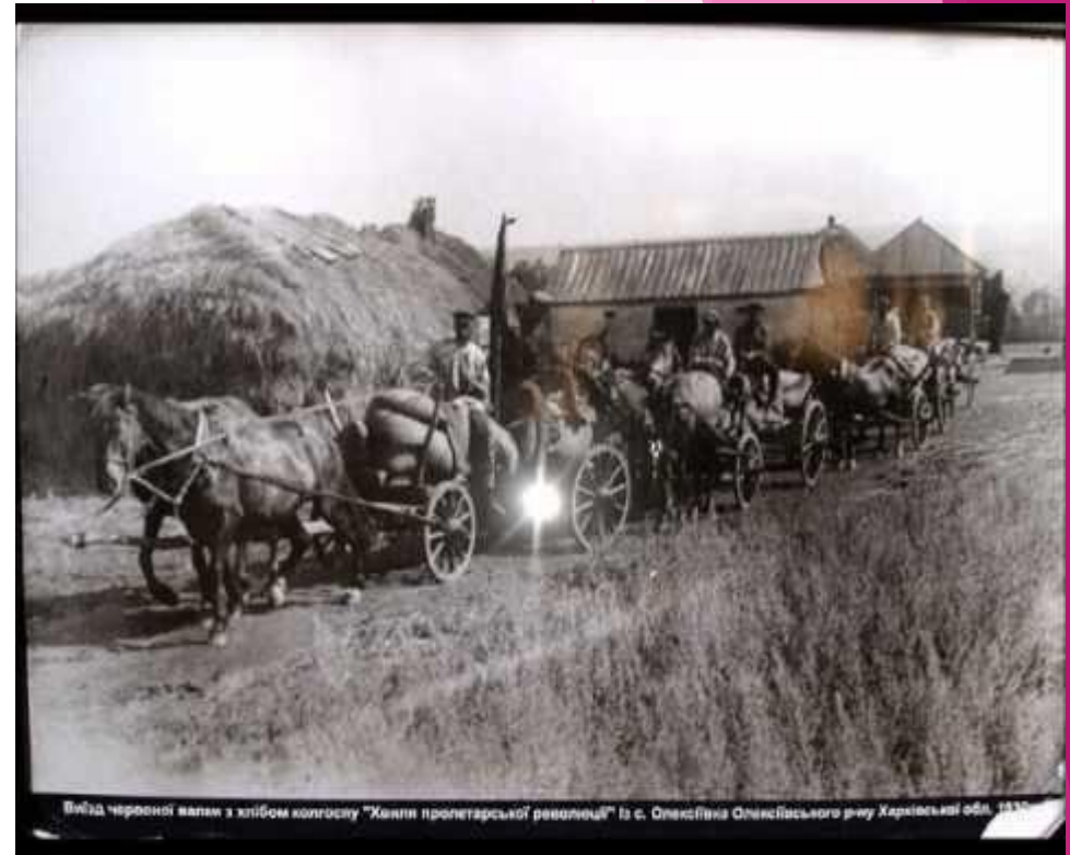
В'їзд червоної валак з хлібом колгоспу "Хлість пролетарської революції" із с. Олександрівна Олександрівського р-ну Харківської обл., 1935