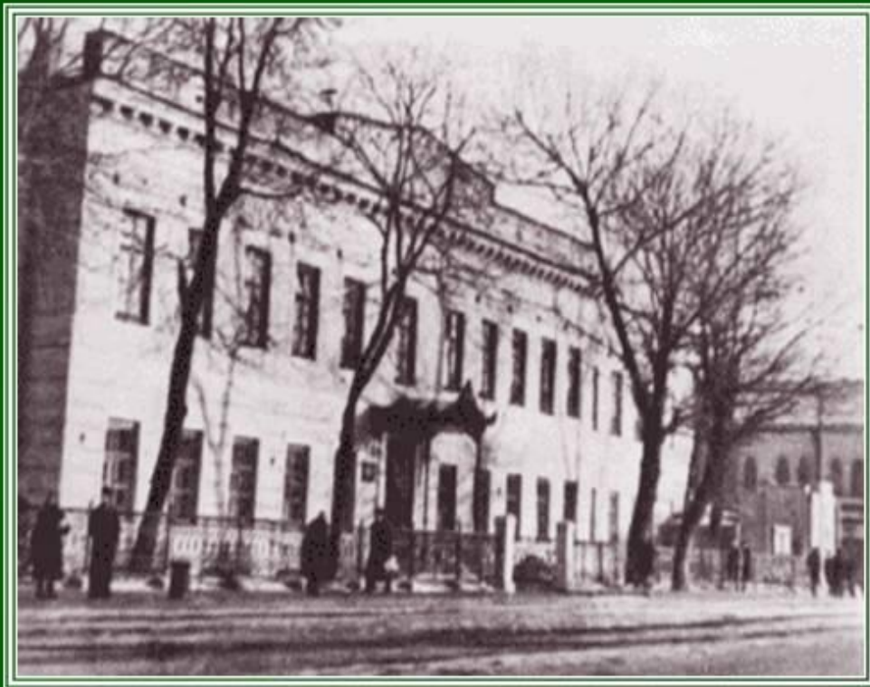
Орловская гимназия, в которой учился Л. Н. Андреев