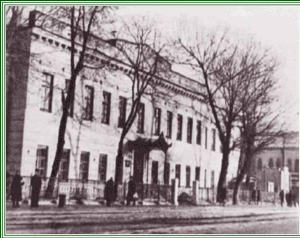
Орловская гимназия, в которой учился Л. Н. Андреев