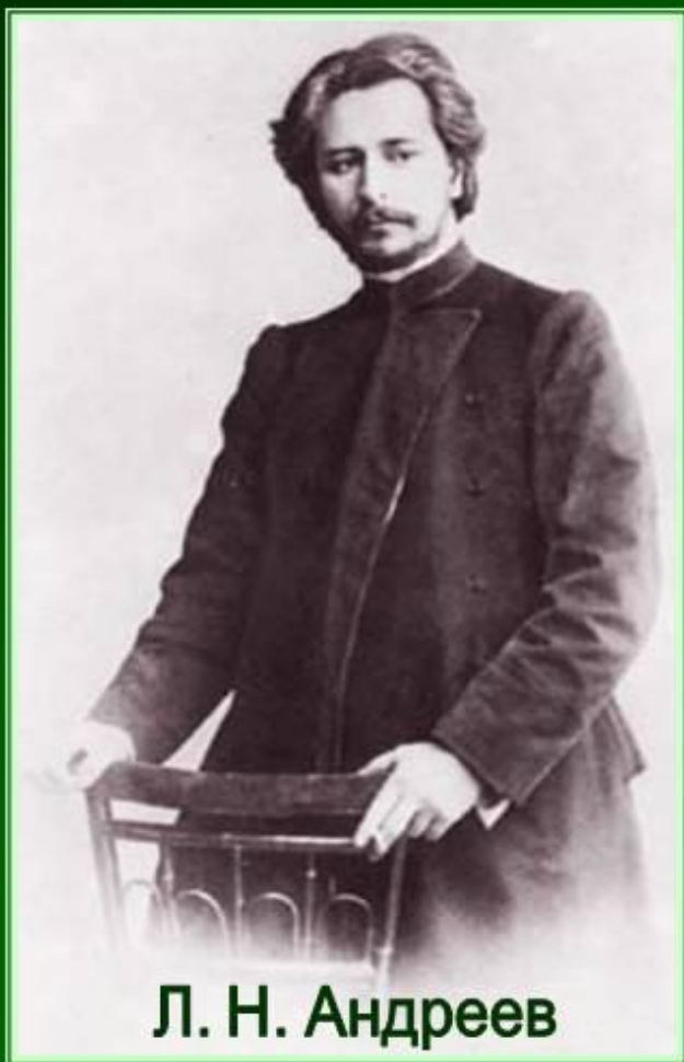
Л. Н. Андреев

Леонид Николаевич Андреев родился 9 (21) августа 1871 года в городе Орле