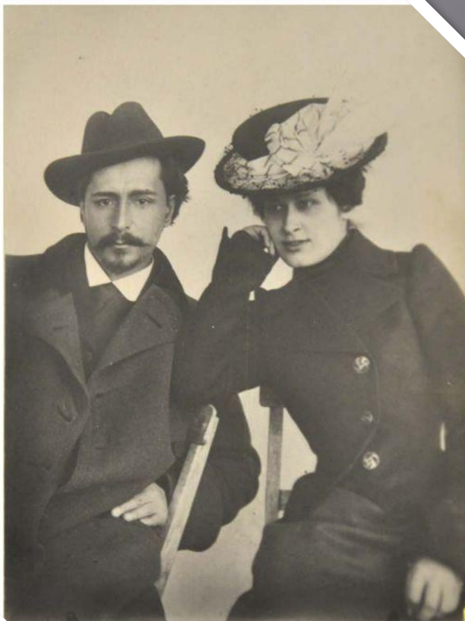
Леонид Андреев и Александра Велигорская