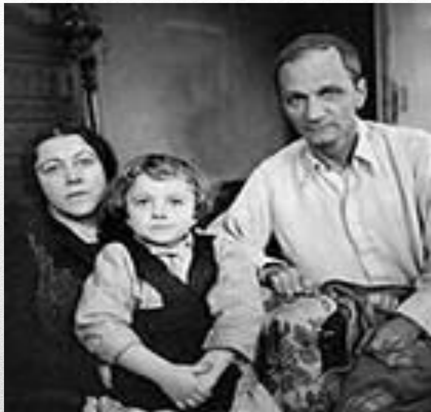
Платонов, его жена и дочь.