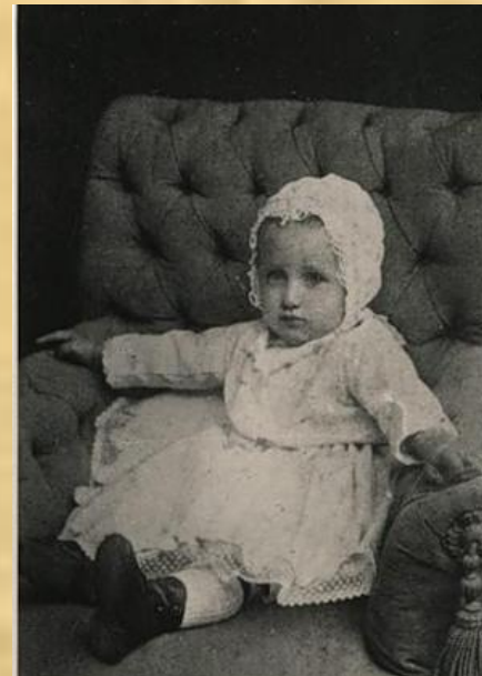
А. Ахматова в детстве